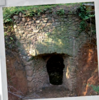
Forn de calç