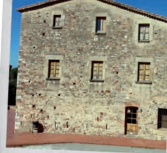
Torre Mossèn Homs