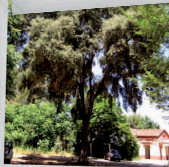
Alzina del Baixador de Torrebonica