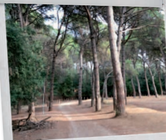
Àrea d'estada del Pi Gros