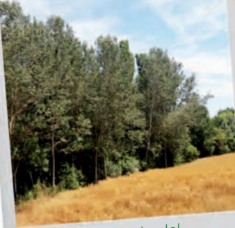
Albereda del torrent de la Grípia

Cal advertir, que la circulació de vehicles de motor està permesa al Camí Vell de Sant Quirze a Matadepera, al Camí Ral de Terrassa a Sabadell i al Camí Ral de Terrassa a Castellar.