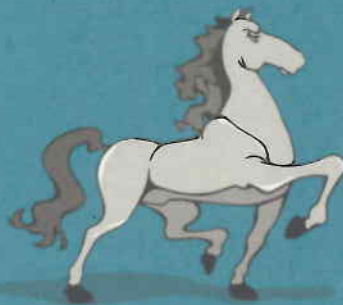
Text extret del llibre Històries i llegendes de Sant Llorenç del Munt i l'Obac , J. Suredes i O. Sanz. Ed. Forrell, 2000.

Conta la llegenda que per aquell indret solia passar-hi un incrèdul i desvergonyat cavaller muntat dalt de sa cavalcadura. Quan passava per sota l'ermita, solia proferir grans injúries i impropis contra el sant titular de la capella. Però un bon dia, quan va injuriar el sant, oom tenia per costum, el cavall se li va encabritar tot dirigint-se perillosament cap a una cinglera del camí. Sense poder aturar el cavall i adonant-se que aquest fet era degut al seu ignominiós comportament, dirigí la seva mirada cap a l'ermita, demanà perdó al sant i prometé corregir la seva irreverent conducta. Just en el moment que el cavall estava a punt d'estimbar-se per la cinglera, rectificà d'un salt la seva posició salvant el cavaller d'una mort segura. Però va quedar la petjada de la ferradura gravada a la roca per a tot aquell que la vulgui veure. (Griera, dins Legendes , 1998, pàg. 173).