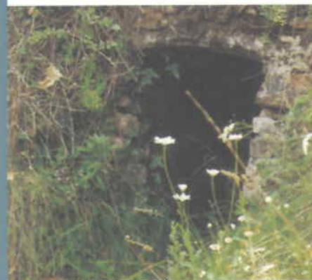
Extret del llibre 70 fonts de Sant Llorenç del Munt i l'Obac , E. Grau i F. Vancells. El Cau Ple de Lletres Editorial, Terrassa, 1997.

La trobarem dins una gran barraca de pedra seca. Té un dipòsit subterrani i, més a l'interior, una mina molt ben construïda també amb pedra. És una interessant mostra de l'arquitectura rural.