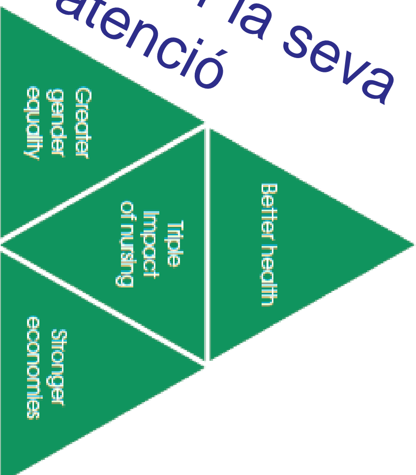
Figure 1.2 The triple impact of nursing: better health, greater gender equality and stronger economies

Col·legi Oficial d'Infermeres i Infermers de Barcelona