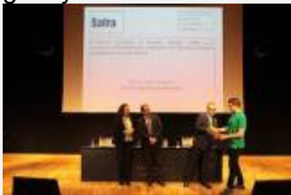
Foto: Entrega premis 5a Mostra de projectes empenedors d'FP

32. Col·laborar amb la Mostra de Projectes Emprenedors de FP de Catalunya organitzada pel Departament d'Ensenyament de la Generalitat aportant projectes guanyadors dels Premis Nous professionals