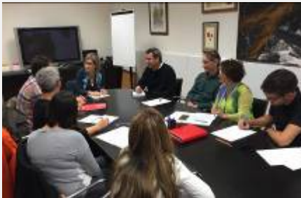
Foto: Reunió grup de treball FCT

8. Mantenir el sistema de traspàs d'ofertes de Formació en Centres de Treball entre les empreses i els centres d'FP, de manera coordinada amb CECOT i Cambra de Comerç de Terrassa que formen part del Grup de treball FCT