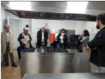
Foto: Cuines de l'escola de segona