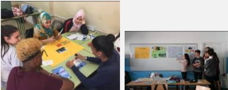
Fotos: Dinàmiques als Instituts "La nostra ciutat: Com formar-nos"

Ocupació, Serveis socials i Joventut per acompanyar 500 joves de 6 instituts