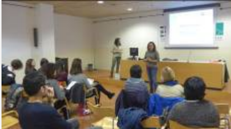
Foto: Xerrada a la Biblioteca Central

23. Coordinar un Grup de Treball “Garantia Juvenil a Terrassa” impulsat per la Comissió Permanent per tal de conèixer els recursos i que els diferents agents col·laborem en l’optimització de la difusió. Cal fer arribar aquests recursos als joves i donar projecció externa a la Garantia juvenil