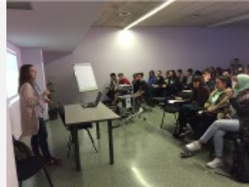
Foto: Jornada d'Orientació al Vapor Universitari

19. Impulsar i difondre 2 Plans de Transició al Treball (PTT Fusta i Cuina) adreçats a 30 alumnes que no van graduar l'ESO i un PFI d'Arts Gràfiques a l'Escola d'Adults La Llar