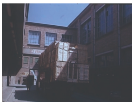
Fotograma del film on podem veure un dels camions Saurer de la Saphil.

L'interès històric-documental del film Objetivo: Calidad és molt alt, començant per les imatges rurals que serveixen per a evocar la matèria primera de la firma, la llana. Immediatament, a través d'una panoràmica vertical, emergeix en pantalla un dels símbols més emblemàtics de la firma, els trenta-set metres de la xemeneia de base quadrada i fust troncocònic del carrer de Galileu amb l'anagrama Saphil, un element construït el 1961. Després d'un canvi de pla, se'ns mostren, de manera molt genèrica, amb el convencional recurs de les panoràmiques horitzontals, els exteriors de la manufactura de Santa Maria de Ripoll.