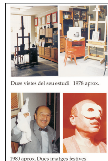
Dues vistes del seu estudi. 1978 aprox.