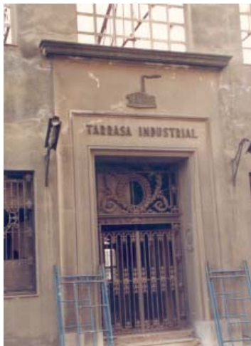
Façana de l'empresa Terrassa Industrial, c. 1990.

A finals de la dècada dels seixanta l'empresa presentà suspensió de pagaments i tancà les seves portes. El complex industrial, a excepció de la xemeneia, s'enderrocà a principis de la dècada dels anys noranta.