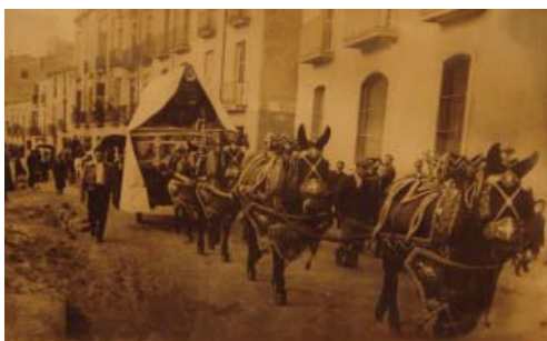
Els cavalls de l'Agència de Transports Cardús durant la passada de Sant Antoni, c. 1933-1935.