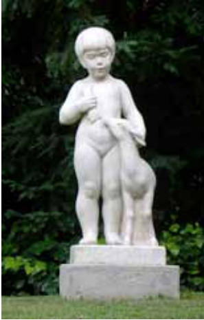
Escultura "Nena i cérvol" de Fernando Bach-Esteve. Jardins de la Casa Alegre de Sagrera

El programa "Som estiu!" que, ofereix una àmplia programació d'activitats relacionades amb el circ, la música... inclou un parell de propostes nocturnes amb l'objectiu d'apropar al públic el patrimoni històric i artístic local.