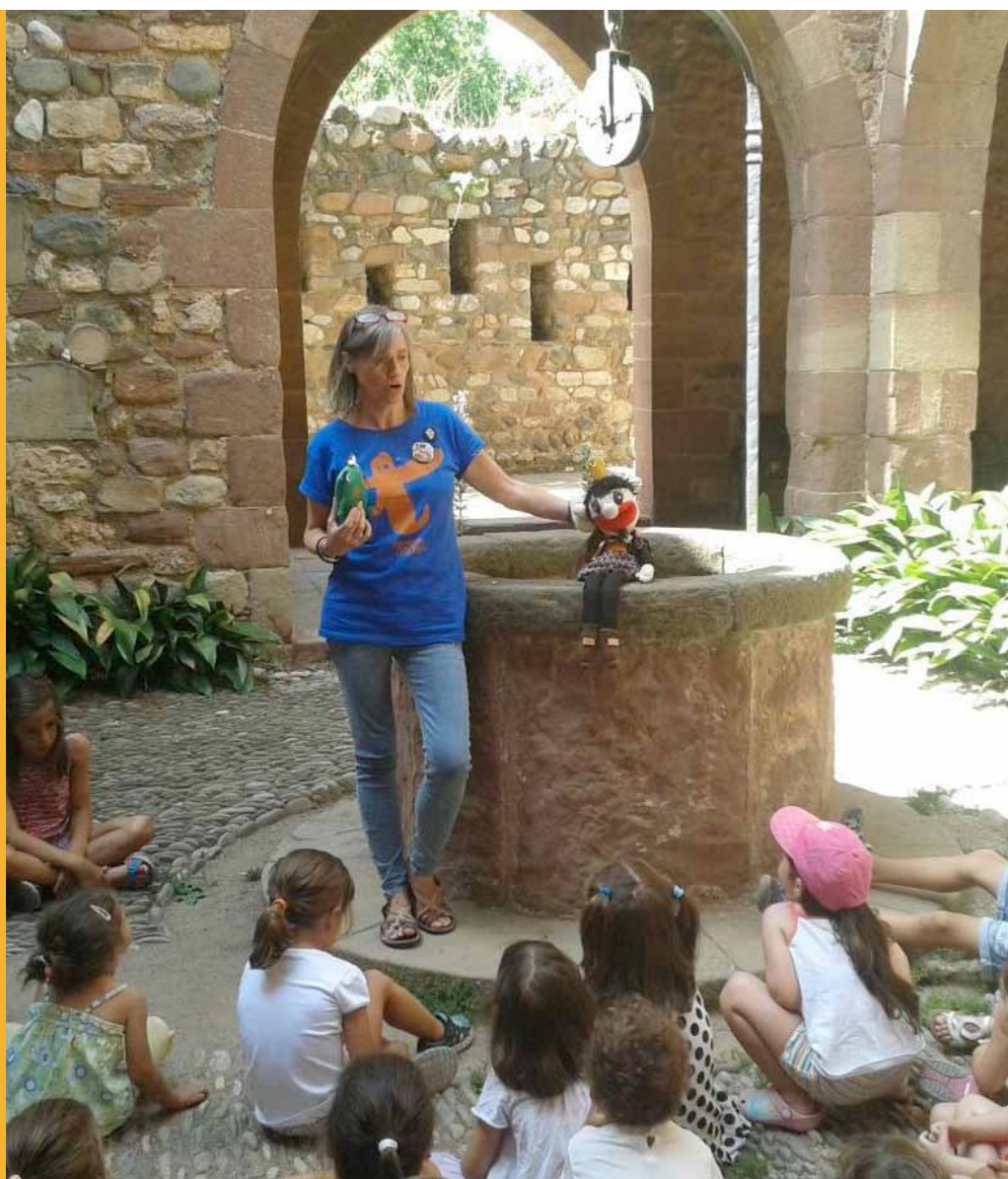
Festa Major infantil. Contes de princeses al Castell Cartoixa de Vallparadís