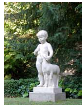
"Nena i cérvol" de F. Bach-Esteve. Jardins de la Casa Alegre de Sagrera

El treball parteix de la necessitat de presentar al públic un ampli i variat ventall d'escultures que ornamenten i embelleixen els espais públics i que estan ubicades en carrers, places, jardins, parcs, rotondes, ... i situar-les físicament en un plànol de la ciutat. L'any 1992, Terrassa va incloure, en el seu Pla Estratègic, un programa d'escultures al carrer. S'inicia un nou urbanisme que pretenia monumentalitzar els barris i dotar-los d'una nova identitat. Es mostren 47 escultures, de diversitat d'èpoques, artistes, estètiques, materials, tècniques, etc.