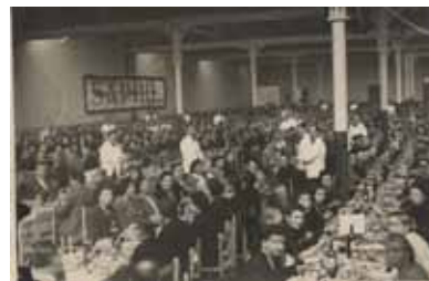
Dinar de l'empresa SAPHIL

El Museu de Terrassa forma part de la Xarxa de Museus i Monuments d'Història de Catalunya - XMHcat que ha treballat en la producció de l'exposició " Fam i abundàncies " que itinerarà per diferents ciutats catalanes. L'exhibició explica l'alimentació humana i la subsistència vista des de diferents disciplines amb l'objectiu de fer reflexionar al visitant. La fam és la protagonista del relat i, més concretament, la lluita per afrontar els atzars de la naturalesa i de la climatologia que han donat lloc a les crisis alimentàries. Terrassa, primera ciutat en acollir-la, la inaugurarà el 13 de gener a les set de la tarda a l'Arxiu Històric de Terrassa - Arxiu Comarcal del Vallès Occidental. Properament rebreu més informació.