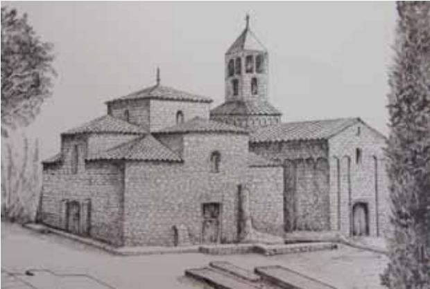
Les esglésies de Sant Pere, 2015.