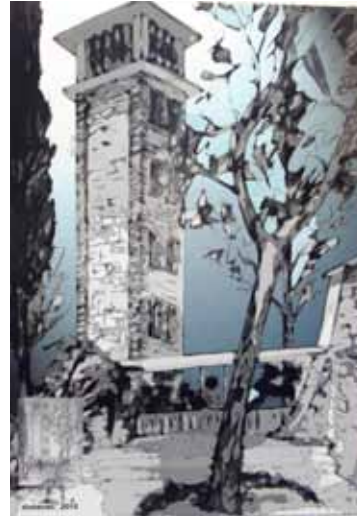
El campanar de la Santa Creu. Figura/Símbol, 2015