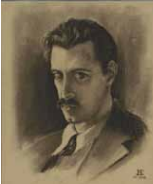
Autoretrat, 1938. Eduard Blanxart.

d'Arts i Oficis de Terrassa. El contacte amb el mestre Rigol li transmeté, al jove Eduard, l'interès per l'art i el disseny, estudiant més endavant a l'Escola Llotja i al Foment de les Arts i del Disseny, ambdós centres situats a Barcelona.