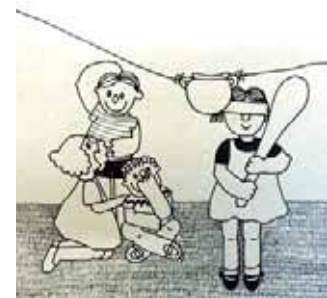
Joc de trencar l'olla, c. 1977.