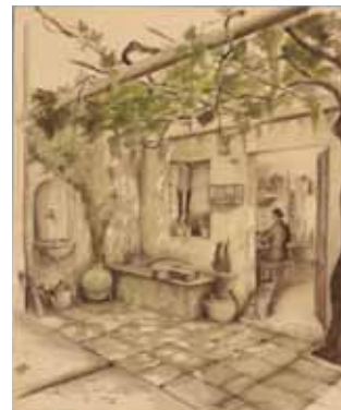
La casa del músic, 1936 Eduard Blanxart.

El Museu de Terrassa ha rebut sis donacions que volem destacar: