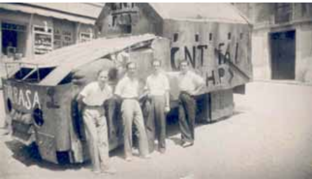
"Tanqueta" davant de la Cuina moderna. AMAT. Col·lecció fotogràfica Baltasar Ragón. 149321. Autor: desconegut.

Terrassa es va adherir a la Declaració del govern de la Generalitat de Catalunya de proclamar el 15 d'octubre de 2015 Dia Nacional en memòria de les víctimes de la guerra civil i les víctimes de la repressió franquista.