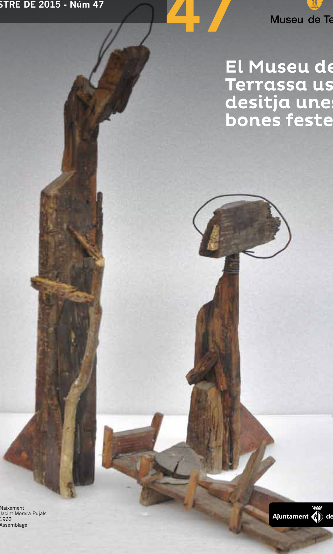
Naixement Jacint Morera Pujals 1963 Assemblage

El Museu de Terrassa us desitja unes bones festes