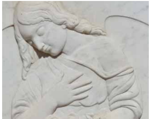
Detall d'una làpida realitzada per Josep Bruix

Les anteriors exposicions "L'arqueologia de la mort" i "Un passeig pels mosaics del cementiri" , patrocinades per la Societat Municipal de Serveis Funeraris de Terrassa i produïdes pel Museu de Terrassa, s'instal·len, de mitjans d'octubre a inicis de desembre, a les biblioteques municipals de Terrassa.