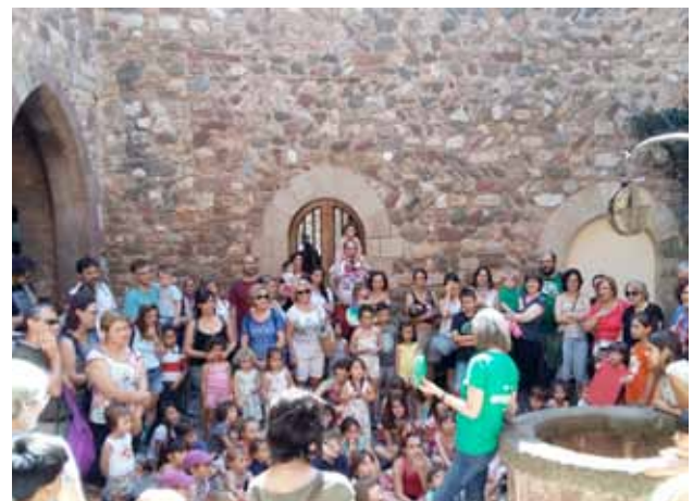
Sessió “Contes de princeses” al Castell Cartoixa de Vallparadís. Festa Major infantil 2016.