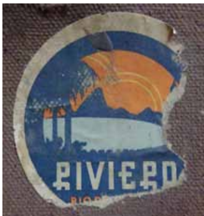
Etiqueta: Hotel Riviero de Rio de Janeiro (Brasil)

Com a jugador internacional va disputar set partits. Va debutar l'abril de 1950 a Lisboa, davant de la selecció de Portugal en el partit de classificació de la Copa del Món que es disputaria al Brasil aquell estiu.