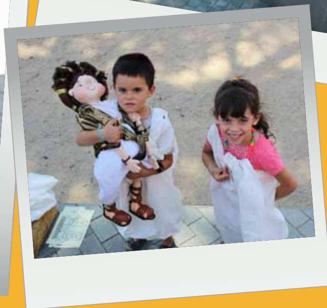
Imatges: Festa Major infantil. Activitat "Una de romans!" a la Seu d'Ègara