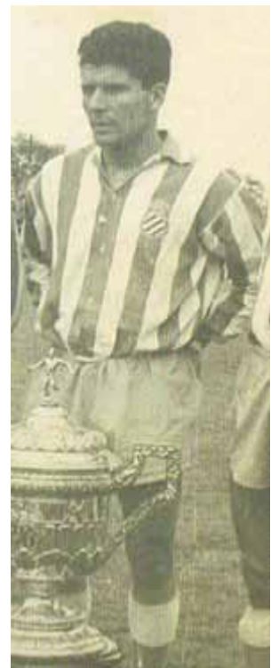
Parra amb la samarreta blanc-i-blava.

El Museu de Terrassa vol adherir-se al record i homenatge del recentment desaparegut jugador amb aquesta mostra del seu equipatge.