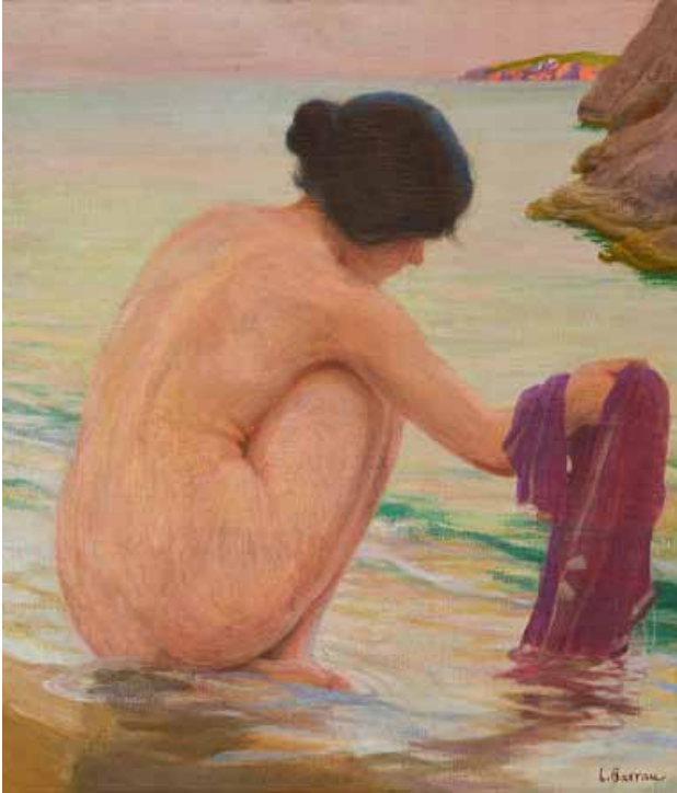
Laureà Barrau i Buñol Nu femení a la platja MdT 12121