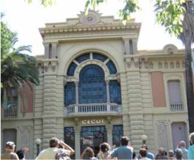
Visites al nostre patrimoni. Visita a la Cecot.

Un any més el Museu de Terrassa participa activament a la Festa Major 2016 . S'han programat les següents activitats: