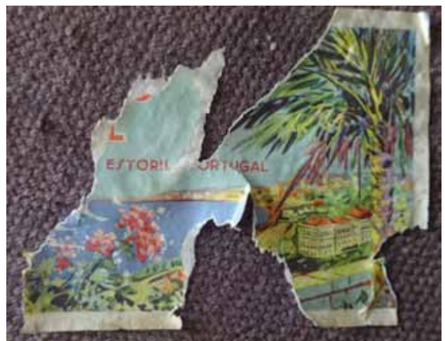
Etiqueta: Hotel ... d'Estoril (Portugal)