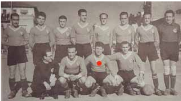
Parra vestint la samarreta del Terrassa F.C.

Dos anys més tard, fitxarà pel R.C.D Espanyol on passarà a ocupar la posició de defensa central, formant part de la línia defensiva històrica del club amb el terrassenc A. Argilés i amb "Cata". Vestirà la samarreta blanc-i-blava en 216 partits i marcarà un sol gol. Deixarà el club l'any 1959.