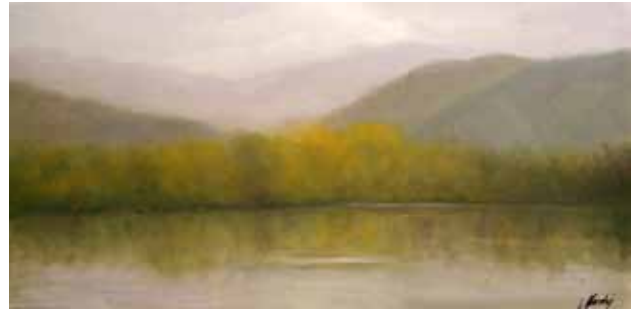
Tardor al llac de Grauges (Berga), 2012

Piñol, pintor i mestre de Belles Arts a Barcelona, el qual el motivà fortament. També es formà a l'Escola Municipal d'Arts Aplicades de Terrassa, en les diferents tècniques del dibuix i de la pintura al natural.