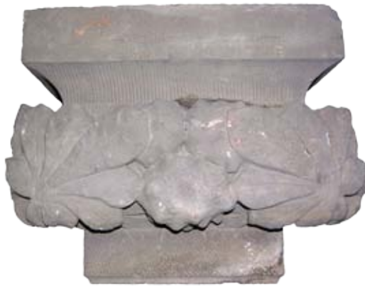
Capitell procedent del Teatre Principal

Properament, el Museu de Terrassa deixarà en préstec temporal un capitell de pilastra recuperat del Teatre Principal (MdT 26.219). La peça es podrà veure, a partir del 15 de març de 2018, als Museus d'Esplugues de Llobregat (MEL) en una exposició que portarà per títol "Modernisme. De la natura efímera a l'arquitectura".