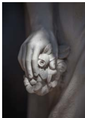
Família Carreras. L'arcàngel de la reconciliació. Detall. Autor: Bronzes Jordà (c. 2000)

Les exposicions d'anys anteriors: “ L'art a les làpides ” i “ Escultures per l'eternitat ” es van instal·lar en les biblioteques municipals de Terrassa (bct xarxa).