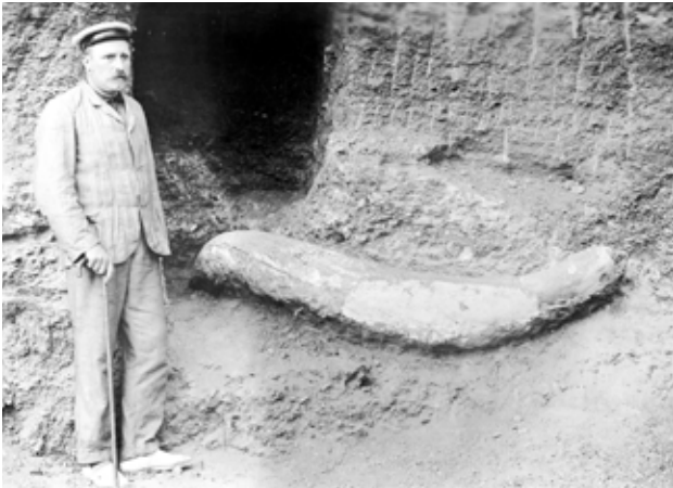
Foto de la troballa de l'ullal de mamut (1907). Josep Rius. AMAT Ref. 391939

Des de mitjans del segle XIX l'excursionisme científic va aparèixer com una manifestació de la renovació de la vida col·lectiva catalana. Sorgit sobretot de l'actuació dels naturalistes, molt aviat va gaudir de molts adeptes que van proclamar la necessitat de redactar un inventari exhaustiu dels recursos naturals i humans que oferia Catalunya. A partir d'aleshores, científics empesos per l'afany de recopilació i estudi van iniciar una tasca de treball de camp i la consegüent teorització, que va assolir una difusió considerable entre la comunitat científica catalana.