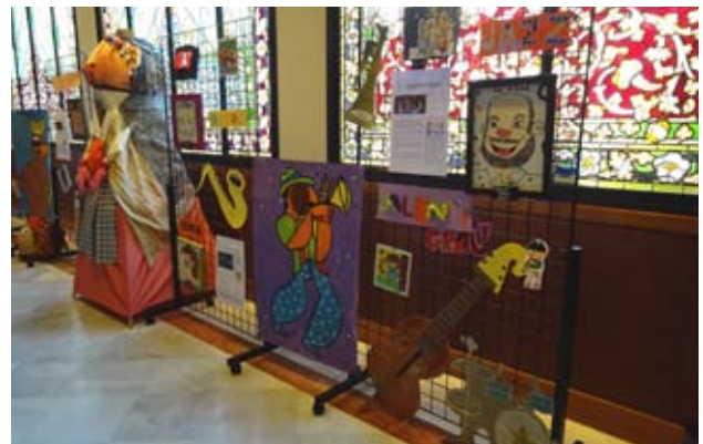
Exposició "Personatges il·lustres 2017" a la Casa Alegre de Sagrera.

"Galeria de personatges il·lustres" que els va apropar a homes i dones que gràcies al seu treball relacionat amb les lletres, el teatre, la música, l'esport, la política, la cultura popular... es converteixen en personatges il·lustres de Terrassa. Al llarg del mes de setembre, al menjador de la Casa Alegre de Sagrera, es va muntar la mostra "Personatges il·lustres 2017" amb alguns dels materials elaborats pels nens i nenes participants en els tallers d'estiu.