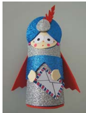
El Patge Xiu-Xiu del Museu de Terrassa

Un any més, el DEAC ha presentat la Guia d'Activitats didàctiques del Museu de Terrassa (curs 2017 – 2018) amb una oferta de 61 activitats (visites, itineraris, tallers, activitats en llengua estrangera i Vallparadís: història i aventura). Destaquen sis novetats: "Les històries de l'arqueòloga Puig", "La Teranyina", "Castell Cartoixa de Vallparadís en Francès", "Castell Cartoixa de Vallparadís in English", "Torre del Palau en Francès", "Medieval Terrassa", "Terrassa Medieval", Visita a la Seu d'Ègara + 2 activitats esportives i Visita al Castell Cartoixa de Vallparadís + 2 activitats esportives. Aquest programa està orientat, especialment, al públic escolar però, també a tots els públics interessats en conèixer el patrimoni històric i artístic de Terrassa. Podeu consultar tota la informació a www.terrassa.cat/visites-itineraris-i-tallers .