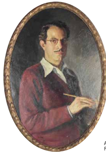
Autoretrat, 1941.