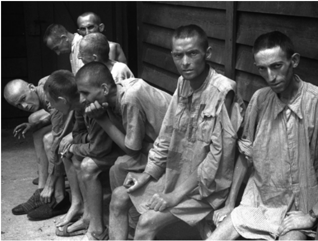
Presos alliberats del camp de Gusen

Dates: del 10 de novembre al 16 de desembre de 2018