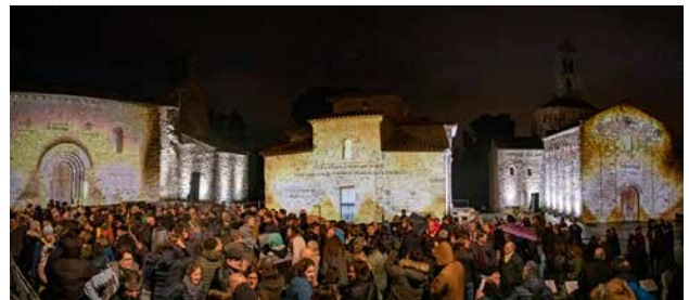
Badia Casanova BCF

- «Funció i distribució dels espais a la Seu Episcopal d'Ègara. Segles IV-VII» a càrrec de M. Gemma Garcia (Ateneu Universitari Sant Pacià, Institut Català d'Arqueologia Clàssica), Antonio Moro (Museu de Terrassa) i Francesc Tuset (Universitat de Barcelona).