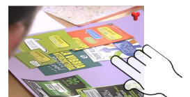
Vídeo Canal Terrassa