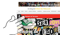
Article "Diari de l'Educació"

Contacte individual amb l'alumnat (de fora del centre) Reunions de coordinació per avaluar el seguiment els serveis i centre educatiu