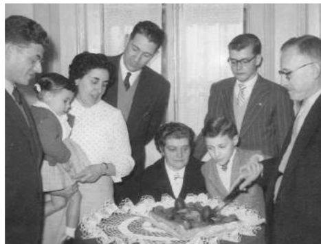
Celebrant la Pasqua el 1960