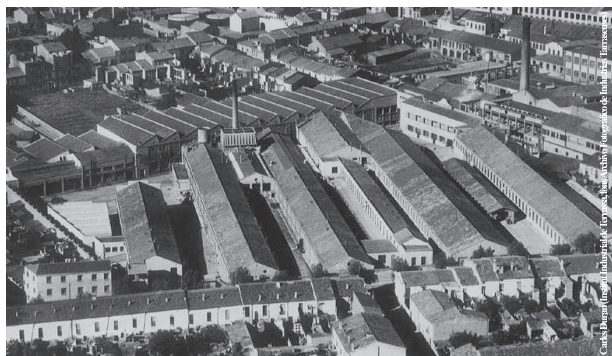
Vista aèria d'una indústria tèxtil de Terrassa (1955)