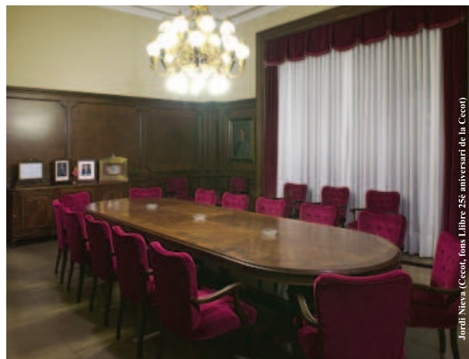
Sala de juntes de la seu de l'Institut Industrial de Terrassa i de la patronal Cecot (2003)

i en la modernització de la gestió empresarial. En aquest sentit, l'Oficina de Productivitat, primer, i després la Secció de Estudios Técnicos, Económico-Sociales y de Productividad, creada el 1964, van oferir serveis d'assessorament a les empreses. La modernització econòmica d'Espanya, les primeres expectatives del Mercat Comú, la culminació de les onades migratòries, la creixent diversificació tècnica i econòmica i la consolidació de Terrassa com un focus de referència antifranquista van ser factors que contribuïren a una reorganització de l'IIT propiciada per noves generacions d'empresaris. A partir del 1964 es crearen noves seccions industrials per resoldre els problemes específics de cada un dels sectors productius: comercialització i transformació fins a pentinament; filatura de carda; filatura d'estam; llanes per a labors; teixits de llana; teixits de drap; gènere de punt i ram de l'aigua. I també es posava en funcionament el Servei d'Informació Comercial.