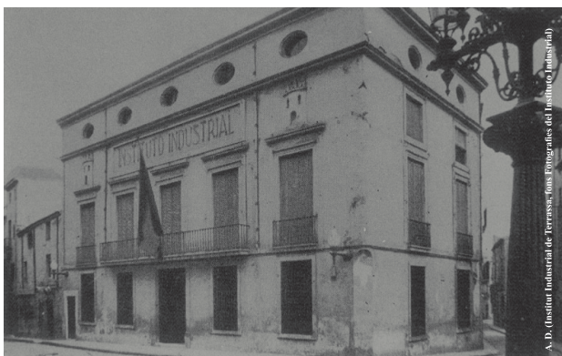
Edifici de l'Institut Industrial de Terrassa, de principi a mitjan segle XX. De mitjan segle XIX fins al principi del XX va acollir la Casa de la Vila (1950)