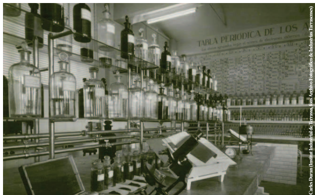
Laboratori tèxtil (1955)

La influència de l'Institut en el Sindicat Nacional Tèxtil (Sector Llana) de la Central Nacional Sindicalista fou molt important, i les relacions amb homes clau de l'època, com Demetrio Carceller, ministre d'Indústria, resultaren determinants, com també l'activitat d'homes com Josep Biosca a Madrid o de plataformes per a la importació i el subministrament com les empreses AGILESA o Suministros y Exportación, S.A., amb les quals es mostrava la supremacia dels industrials llaners terrassencs.