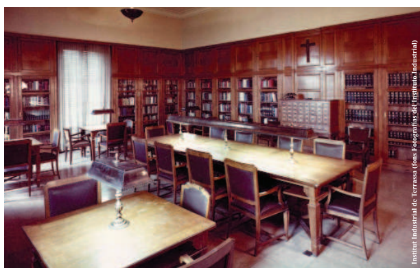
Biblioteca Tecnicotèxtil inaugurada a la seu de l'Institut Industrial de Terrassa el 1952