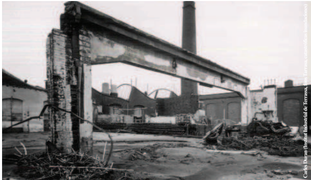
Efectes de la riuada en la indústria terrassenca (1962)