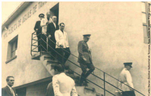
Visita d'autoritats a les instal·lacions de la Mina d'Aigües de Terrassa (1943)