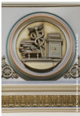
Medalló de la sala octogonal de la cúpula de la Cecot (2003)