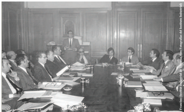
Empresaris a la sala de cursos de l'Institut Industrial de Terrassa (1970)