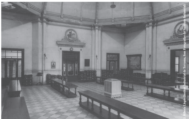
Entrada del Magatzem Freixa, posteriorment seu de l'Institut Industrial de Terrassa (1940)