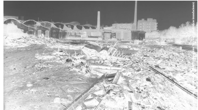
La rambla d'Ègara després de la riuada. Al fons, el Vapor Aymerich i Amat, actual Museu de la Ciència i de la Tècnica de Catalunya (1962)

Carles Duran (Institut Industrial de Terrassa, fons Arxivo Fotogràfic de l'Institut Industrial de Terrassa)