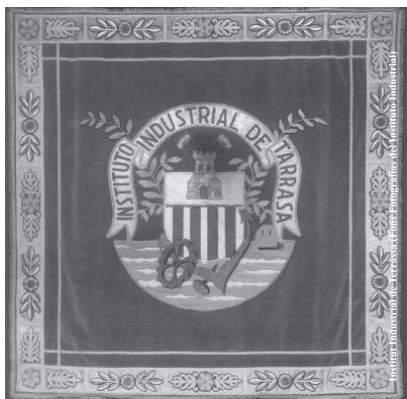
Tapís amb l'emblema de l'Institut Industrial de Terrassa ubicat a la sala d'actes de l'edifici del carrer de Sant Pau (1960)