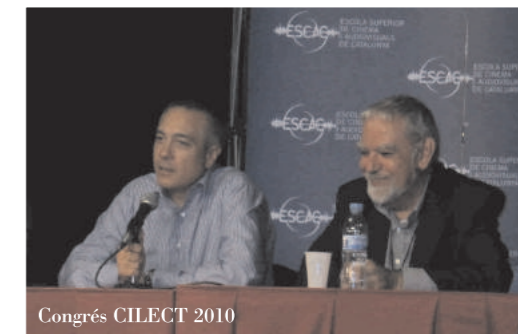
Congrés CILECT 2010