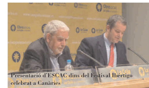
Presentació d'ESCAC dins del Festival Ibèrtigo celebrat a Canàries