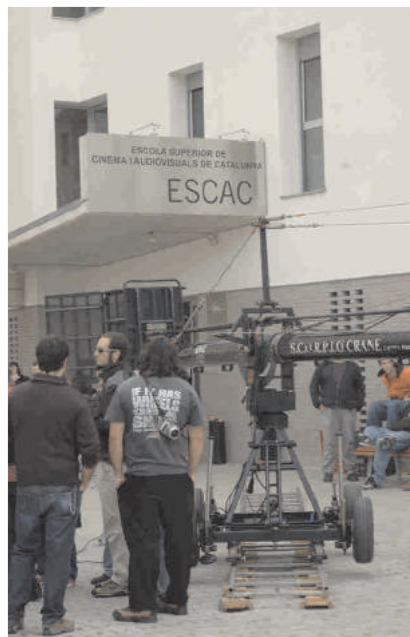
Alumnes treballant en un rodatge