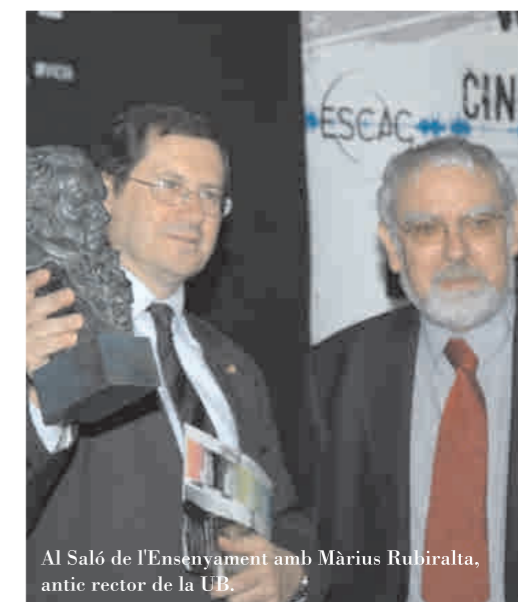
Al Saló de l'Ensenyament amb Màrius Rubiralta, antic rector de la UB.