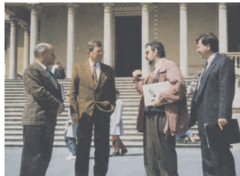
A l'Escola Pia de Sarrià