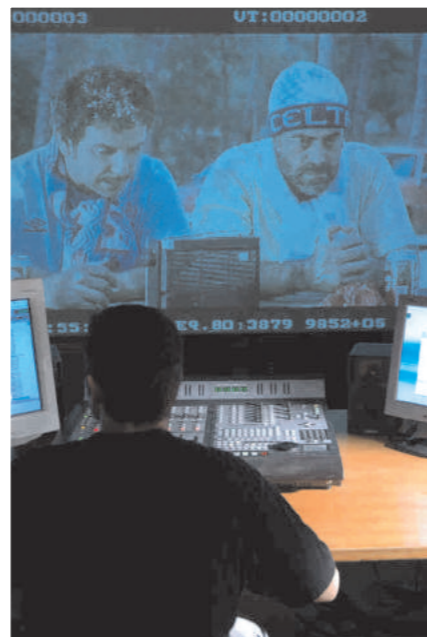
Sessió de postproducció a l'ESCAC