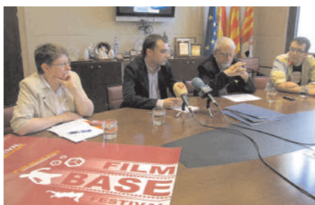
Presentació del Base Film Festival