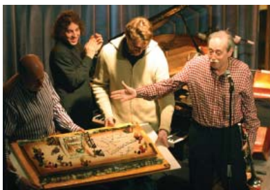
Celebrant el premi Jazzterrasman 2015