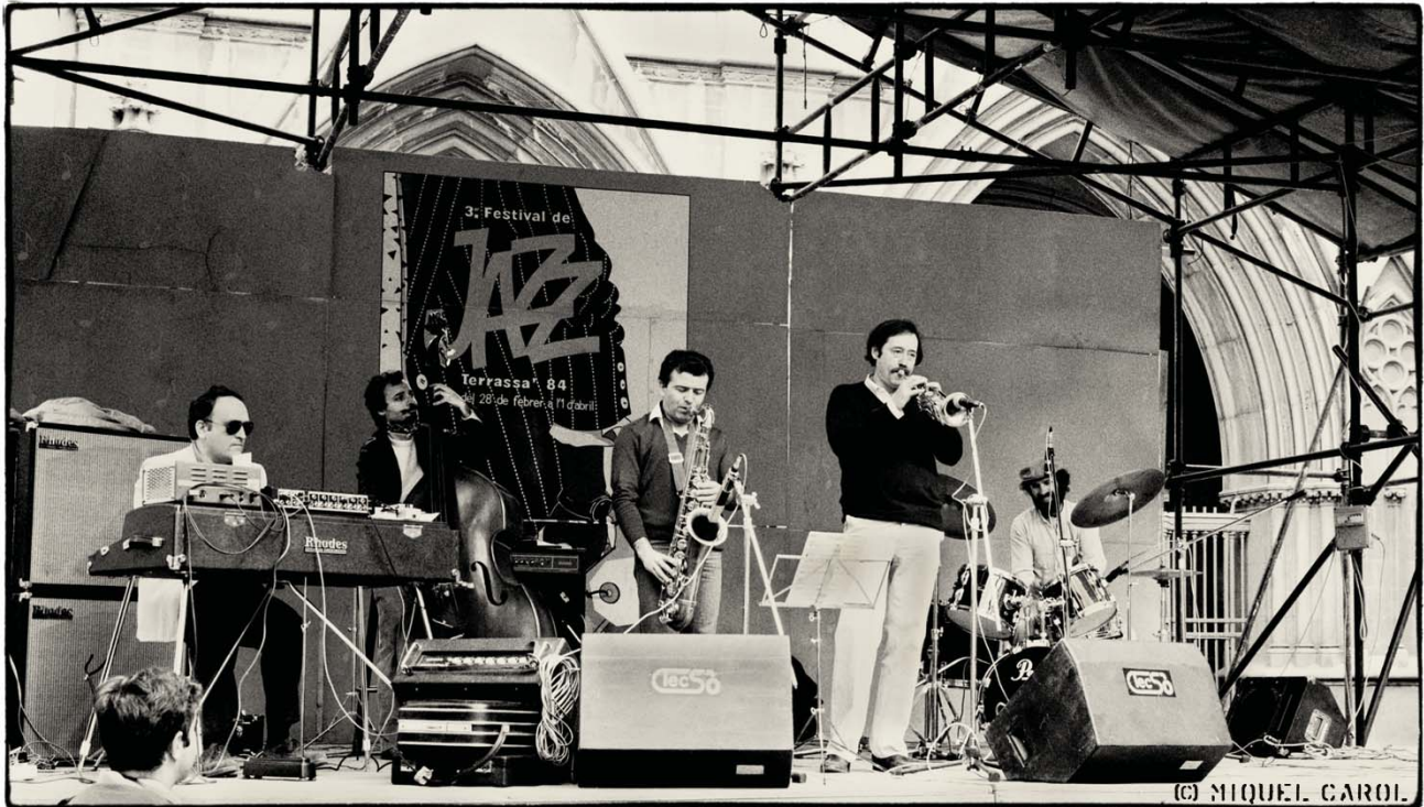
Actuant amb el Quintet d'Egara, a la plaça Vella en el marc del 3er Festival de Jazz Terrassa, el 1984