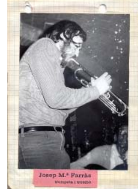
El 1978, tocant a l'antiga Jazz Cava