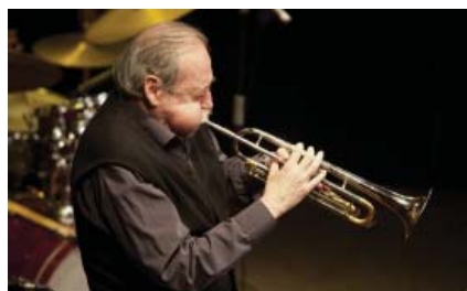
Inauguració del 32è Festival de Jazz de Terrassa