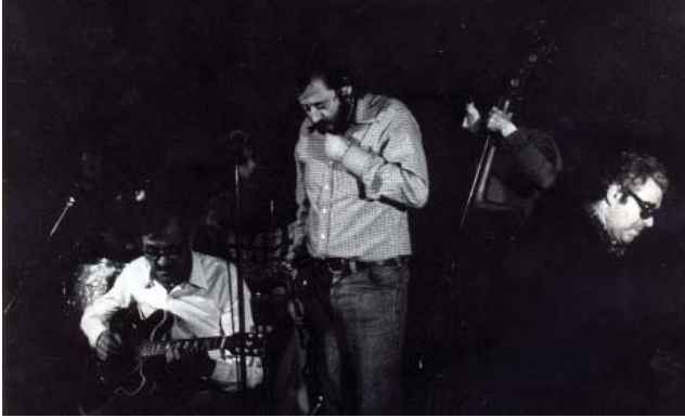
Amb el Modern Jazz Quintet, el 1978