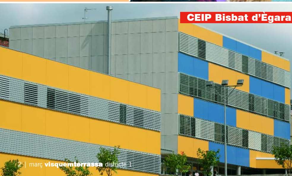
CEIP Bisbat d'Ègara

Durant el curs 2009-2010 es va ampliar l'Escola Bisbat d'Ègara de dues a tres línies d'educació infantil i primària. Amb les obres d'ampliació s'han construït sis aules, una aula d'informàtica, una aula de suport, dues tutories i dues aules per a petits grups, amb una inversió de la Generalitat de 2.000.000 euros. D'altra banda, al 2008 es van enllestir les obres d'ampliació de l'Institut Montserrat Roig a tres línies d'ESO i tres línies de Batxillerat. Les obres van comportar una inversió de la Generalitat superior a 1,1 milions d'euros.