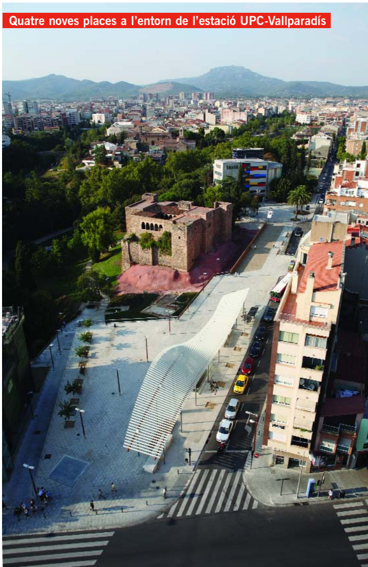
Quatre noves places a l'entorn de l'estació UPC-Vallparadís

Les noves places construïdes després de la reurbanització dels carrers de Salmerón i de la Igualtat s'han convertit en miradors privilegiats al parc de Vallparadís i a edificis emblemàtics com ara el Castell Cartoixa