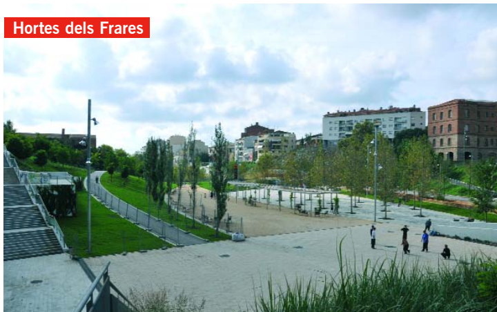
Hortes dels Frares

El tram del parc de Vallparadís situat entre el pont de l'av. de Jacquard i el del Cementiri Vell, les Hortes dels Frares, es va reobrir al públic al 2010 amb novetats: una gran esplanada amb graderies, una nova pèrgola, nous arbres i jocs infantils.