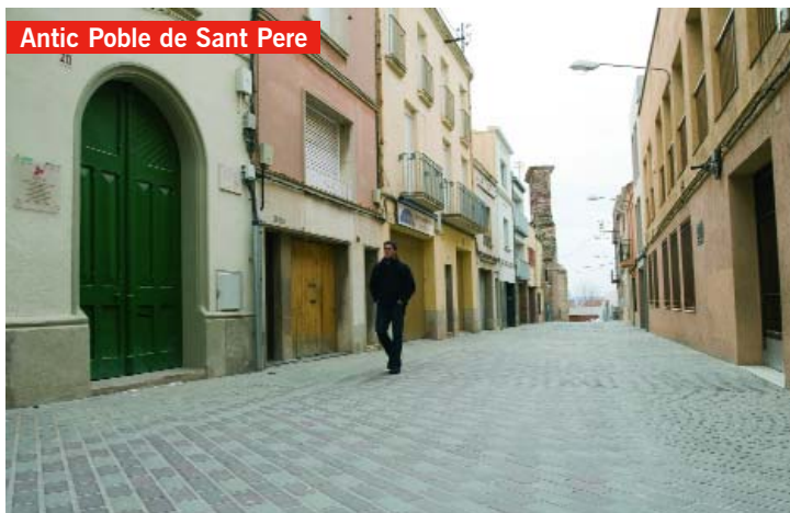
Antic Poble de Sant Pere

Les obres d'urbanització de l'Antic Poble de Sant Pere, amb un pressupost global de 3 milions d'euros, no es limiten a millorar la pavimentació, sinó que volen harmonitzar aquesta zona amb la nova imatge de la Seu d'Ègara.