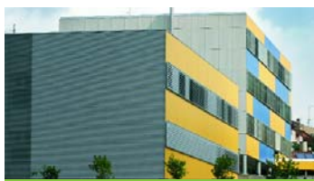
Ampliació Bisbat d'Ègara