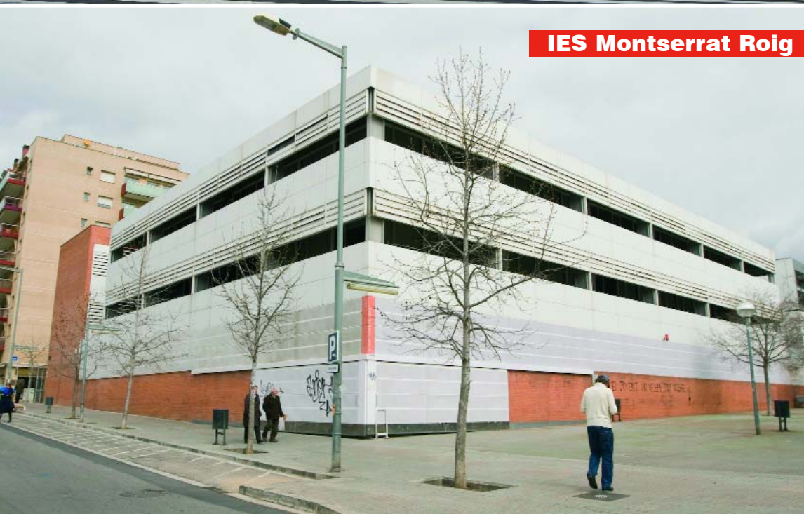
IES Montserrat Roig

A finals del 2009 s'inaugura la restauració i millora de la Casa Baumann. Concretament, es va recuperar la façana i la coberta i es va instal·lar un nou ascensor exterior per adequar l'edifici a les normes d'accessibilitat. Les obres van tenir un cost de 552.000 euros sufragats pel Fons Estatal d'Inversió Local. Coincidint amb la inauguració de la reforma es va posar en marxa la nova Oficina Municipal d'Emancipació Juvenil. La Baumann també acull el Servei de Joventut i Lleure.