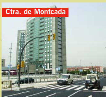
Ctra. de Montcada

S'està urbanitzant un tram de 3.254 m 2 de la carretera de Montcada entre la carretera de Rubí i el carrer de Vallparadís. El pressupost és de 696.000 euros i contempla el desdoblament de la calçada amb una mitjana central pavimentada i l'ampliació de les voreres