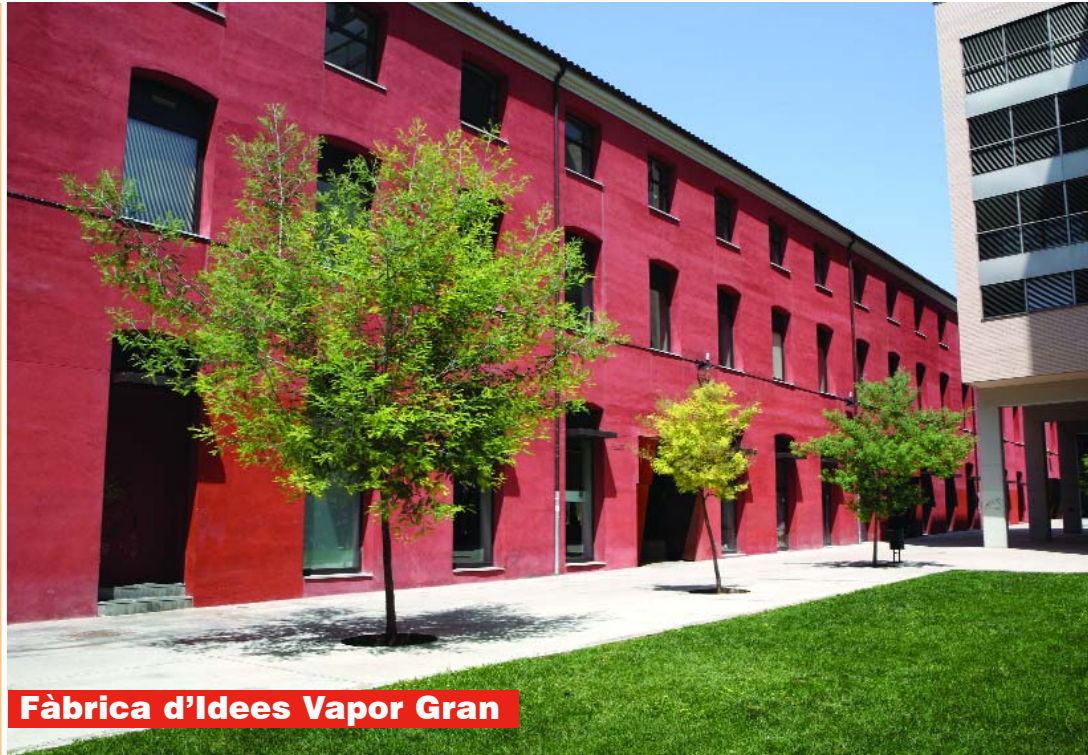
Fàbrica d'Idees Vapor Gran

Enguany es faran les obres d'adequació de la "Fàbrica d'idees", a la segona planta del Vapor Gran, per fer-hi fins a dotze locals on s'hi instal·lin empreses d'alt valor afegit que facin de "llançadora" per a noves idees. La iniciativa s'emmarca en l'aposta per fer de Terrassa un dels principals pols d'innovació de Catalunya, dins del projecte del Parc Científic i Tecnològic Orbital 40. L'objectiu és que aquelles empreses que s'instal·lin, disposin d'eines, recursos i serveis per facilitar que els seus projectes es tradueixin en la instal·lació d'empreses tant a la zona de l'Orbital 40 com al voltant de la franja nord. Les obres, amb un cost de 691.000 euros, les finançaran els fons europeus Feder, la Diputació i l'Ajuntament.