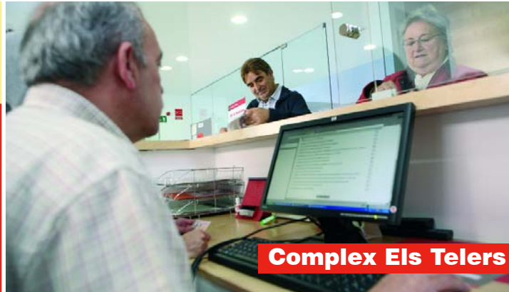
Complex Els Telers

centre, antic poble de sant pere, vallparadís, cementiri vell, escola industrial-plaça catalunya