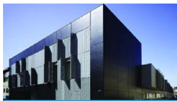
Complex Els Telers