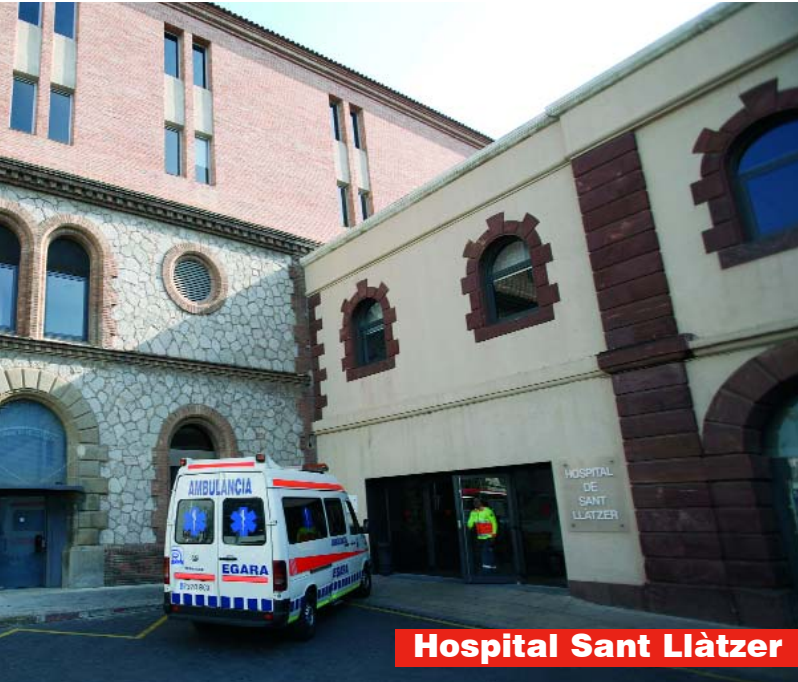
Hospital Sant Llàtzer