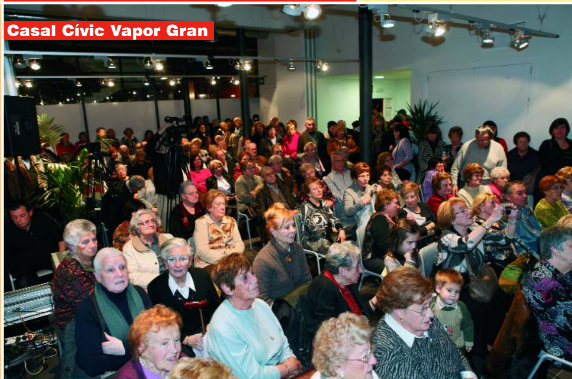
Casal Cívic Vapor Gran

El 5 de febrer d'enguany es va inaugurar el Casal Cívic del Vapor Gran. Construït en uns espais lliures de l'antic Vapor Gran, el local compta amb 360 m 2 distribuïts entre una sala polivalent, una recepció, un magatzem i una zona amb quatre despatxos. La façana del local dona al carrer dels Telers i al passeig del Vapor Gran, al costat del Servei d'Habitatge. La gestió del local va a càrrec de l'Ateneu Terrassenc per un període de quatre anys. L'Ajuntament hi ha invertit més de 315.000 euros, entre les obres de rehabilitació del local i la dotació de mobiliari.