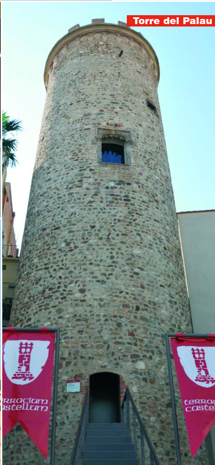
Torre del Palau

Ja han començat les obres de construcció de la nova residència del Campus de la Universitat Politècnica de Catalunya. El nou edifici s'ubica en un solar cedit per l'Ajuntament entre la rambla de Sant Nebridi i el carrer de Miquel Vives. La nova residència de la UPC estarà a punt l'estiu del 2012. Comptarà amb una oferta d'entre 75 i 90 nous apartaments de 20, 30 i 36 m 2 que acolliran unes 100 persones entre alumnes, professors i investigadors. La nova residència se sumará així a la que ja hi ha al carrer de Ramón y Cajal, que acull uns 200 estudiants.