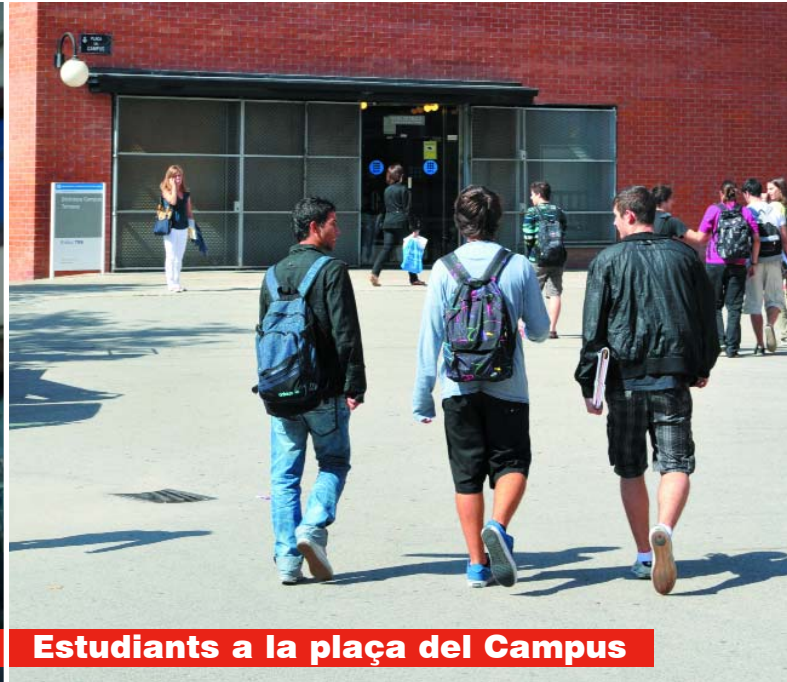
Estudiants a la plaça del Campus