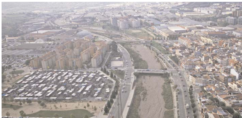
Vista aèria dels barris de Montserrat i de Ca N'Anglada, separats per la riera de Les Arenes

E l Pla de Barris concentra en la seva darrera fase el gruix de les obres previstes al districte II per millorar l'aspecte i la mobilitat d'alguns carrers i avançar en la cohesió territorial salvant la barreira natural que representa la riera de les Arenes. Les obres de la passarel·la de Jacint Elias ja estan en marxa i les del carrer Mare de Déu del Carme ho faran en