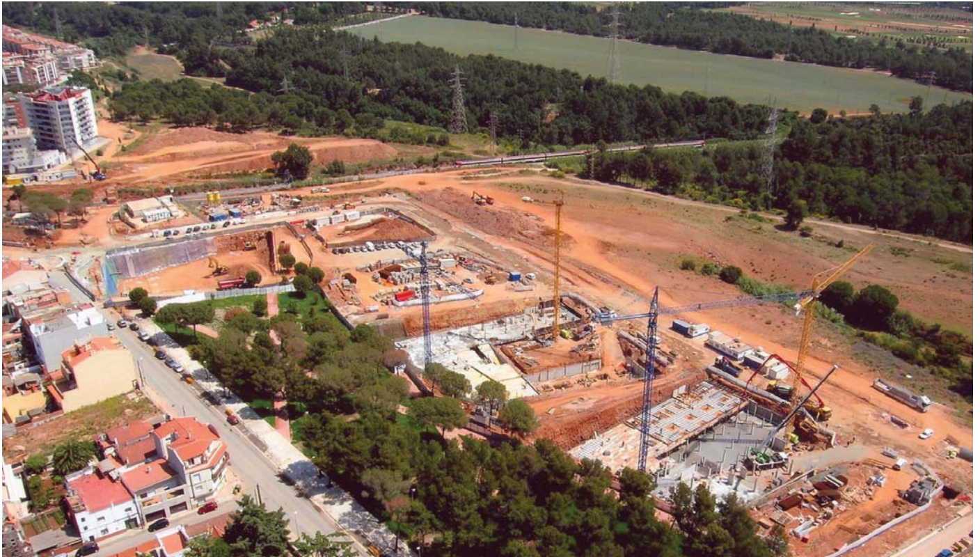
Imatge del nou Parc de Guernika i de la construcció de nous habitatges a Torre-sana

El parc forma part d'un projecte d'urbanització del barri de Torre-sana, que inclou 900 habitatges de protecció oficial