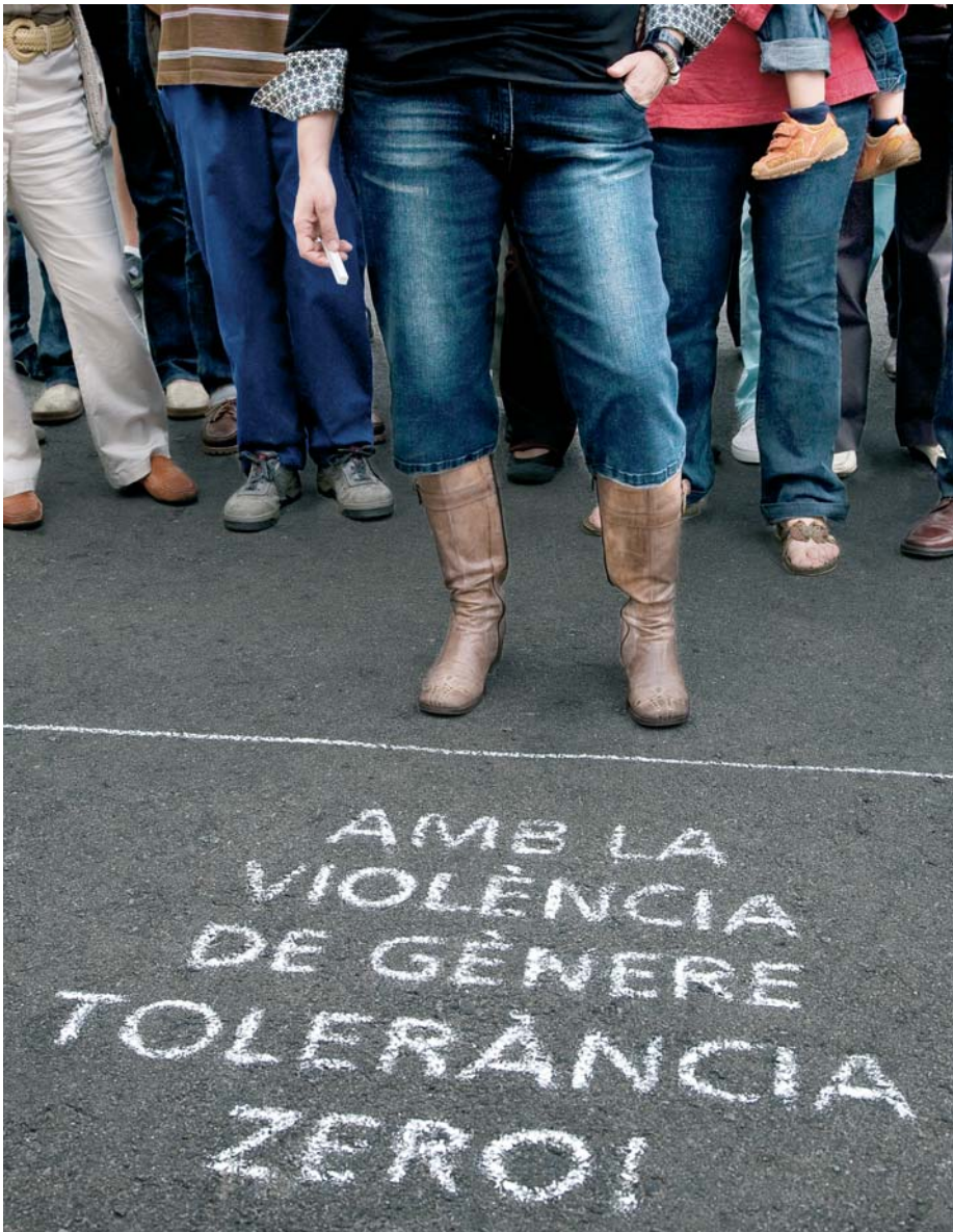
Cartell de la campanya Amb la violència de gènere: Tolerància Zero!

L'Ajuntament commemora tot aquest mes amb un seguit d'activitats el Dia Internacional contra la Violència de Gènere, que se celebra el 25 de novembre. Per conscienciar sobre els maltractaments a les dones i informar i sensibilitzar els ciutadans i ciutadanes, la Regidoria de Polítiques de Gènere organitza la campanya Amb la violència de gènere: Tolerància Zero , que inclou diverses iniciatives per provocar la reflexió de la ciutadania i promoure la seva implicació en la lluita contra la violència. El consistori ha rebut una subvenció estatal per dur a terme diferents accions contra la violència de gènere a la nostra ciutat, com ara la validació a tot Espanya d'un qüestionari de detecció de maltractament psicològic en dones que pateixen violència domèstica per part de la