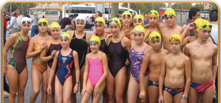
Participants del Club Natació Terrassa en la 80a Travessia al port de Barcelona. J. Michavila