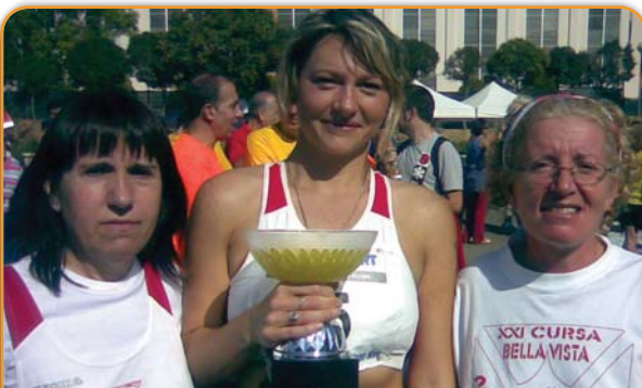
Equip femení d'atletisme del C. Natació que va proclamar-se campió de Catalunya de 10.000 metres a la XIX Cursa de Fons a Sant Muç.