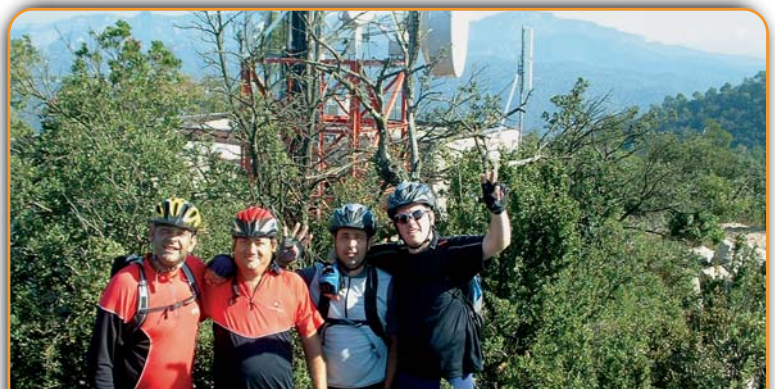
El club Zampa-Zampa coronant el Turó de Cal Ros, a Viladecavalls. J. Perera

Les fotografies hauran d'anar acompanyades del nom de l'autor o autora, l'adreça postal, el telèfon de contacte i una explicació molt breu de la fotografia. Es poden enviar per correu postal a: