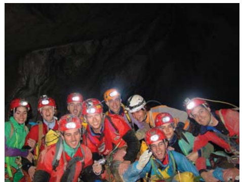
Imatges de diferents activitats realitzades pels socis del club

V italitat. Amb aquesta paraula n'hi hauria prou per definir una entitat que camina amb pas ferm per celebrar l'any 2010 el seu centenari. El Centre Excursionista de Terrassa (CET) està format per set seccions que agrupen les activitats que realitza el club, entre les quals n'hi ha de tan diferents com la fotografia, l'esquí o les ciències naturals, sense oblidar, és clar, l'excursionisme, factor clau en el naixement del