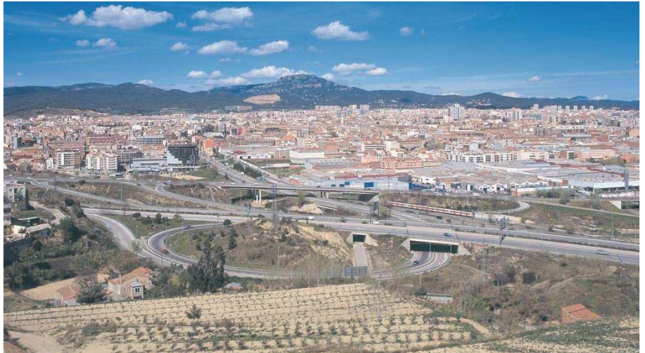
La divisió de la ciutat en els actuals districtes està vigent des de l'any 1992

E ls Consells Municipals de Districte (CMD) orienten actuacions distributives i igualitàries en el territori i asseguren una representació dels interessos dels diferents barris de la ciutat en la política municipal. El president, el ple del consell i les comissions sectorials d'entitats formen els seus òrgans de govern. Al ple de cada consell hi ha