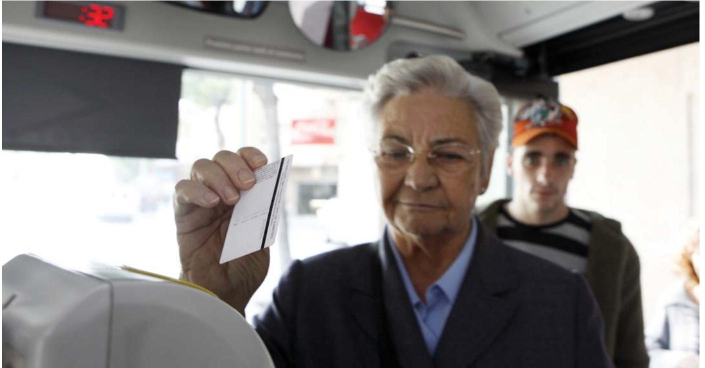
La mitjana d'usuaris dels autobusos municipals és de 40.000 viatgers diaris

→ Aquesta mesura social beneficia un col·lectiu de més de 30.000 persones, que podran disposar d'un carnet renovable vàlid per a 2 anys. L'Ajuntament informarà prèviament i en detall sobre el mecanisme per a la tramitació i distribució dels futurs carnets