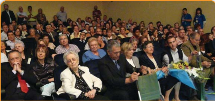
Homenatjats en un acte del programa de celebració del 50è aniversari de la presència dels Salesians a Terrassa. L.Mur.