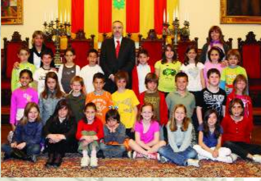
► Escola Pia