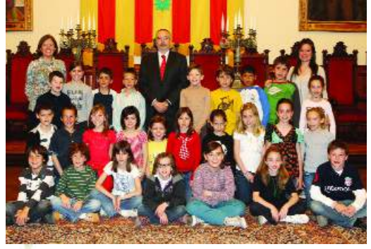
► Escola Pia