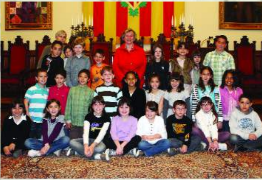
► CEIP França