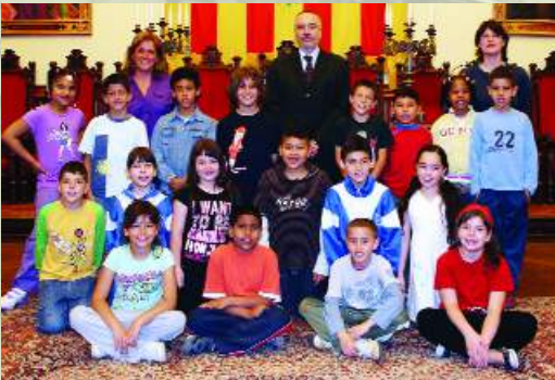
► CEIP Sant Llorenç