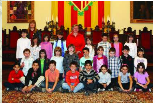
► CEIP França