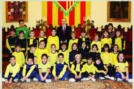
► Maria Auxiliadora