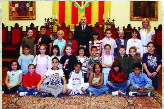
► CEIP Sant Llorenç