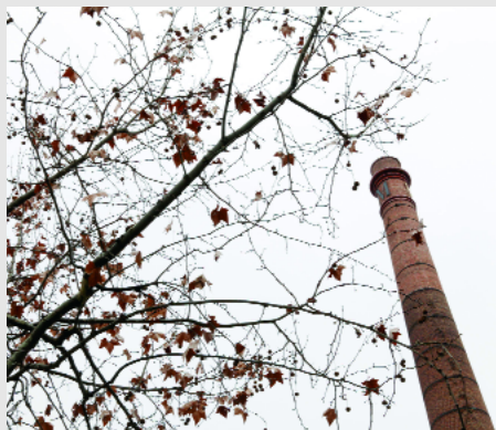
S'han plantat 57 nous plataners, 17 freixes de fulla gran, 3 til·lers, i 2 liquidàmbars