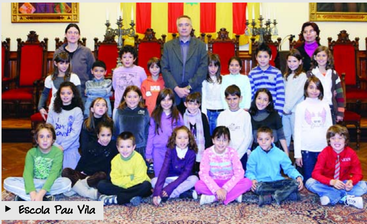
► Escola Pau Vila