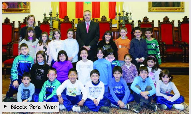
► Escola Pere Viver