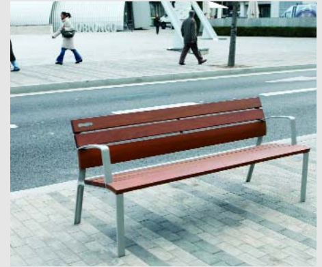
La Rambla comptarà amb 48 nous bancs Neoromàntics del dissenyador Miquel Milà

de perímetre, per recuperar la imatge històrica de la Rambla. Concretament, s'han plantat 57 plataners, 17 freixes de fulla gran, 3 til·lers i 2 liquidàmbars. Al tram comprès entre els carrer d'Arquímedes i de Galileu, l'arbrat s'ubica de manera més aleatòria.