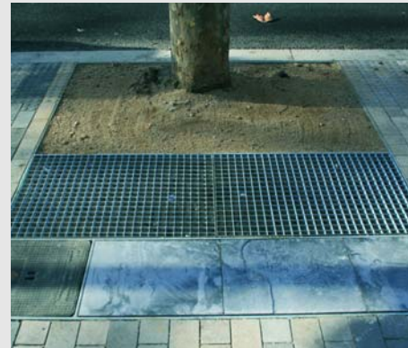
Alguns dels escocells incorporen una pa-perera i una arqueta amb un punt de llum