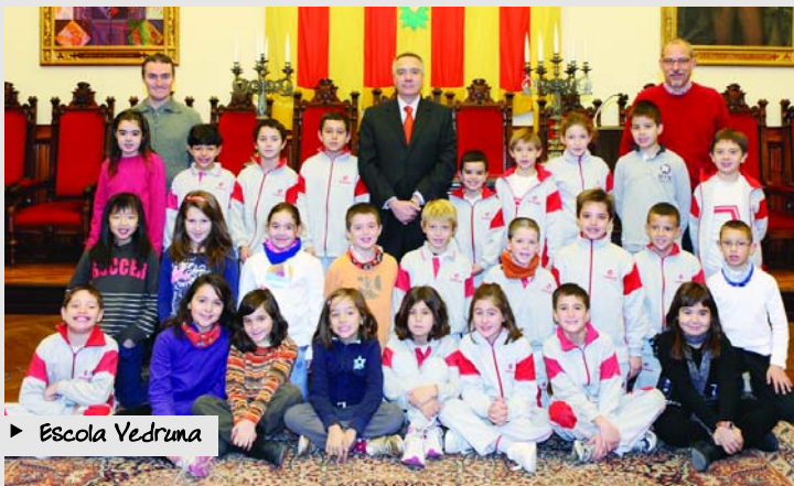
► Escola Vedruna