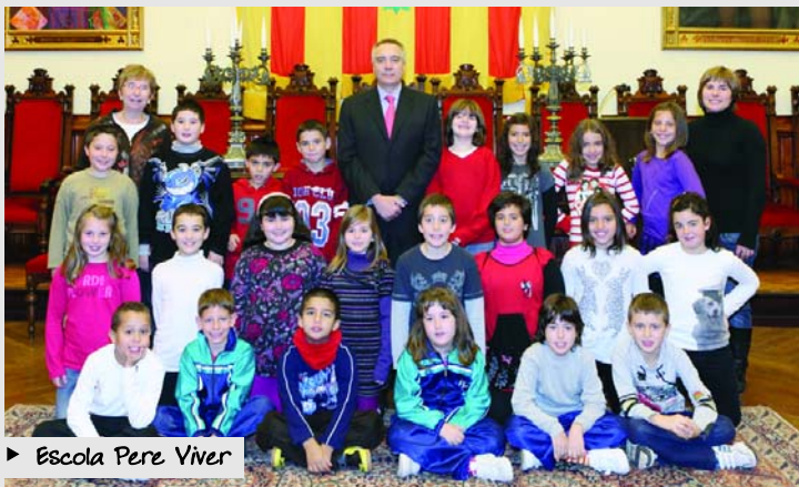
► Escola Pere Viver