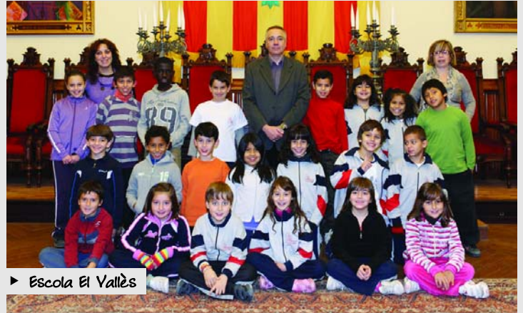
► Escola El Vallès