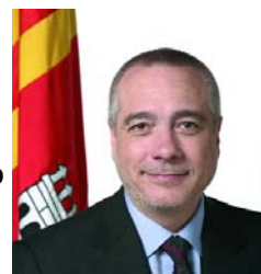
Pere Navarro i Morera Alcalde de Terrassa

Amb la nova Rambla, fruit d'un procés de participació ciutadana, Terrassa guanyarà un espai urbà remodelat, pensat per als vianants, però també per al transport públic, els vehicles de serveis i els accessos de veïns. El projecte ha tingut en compte els usos dels ciutadans de la rambla d'Ègara, la dinamització comercial i els elements més singulars del seu paisatge.