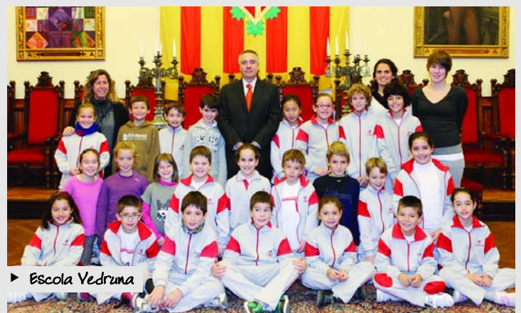
► Escola Vedruna