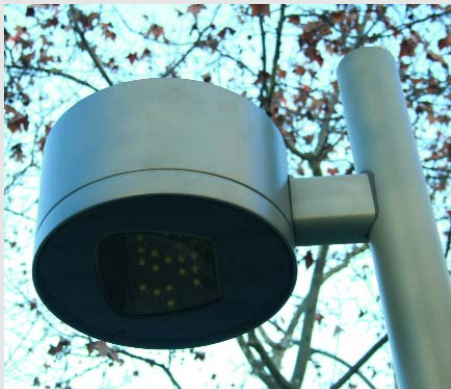
S'instal·laran un total de 140 punts de llum a diferents alçades a les voreres i al passeig