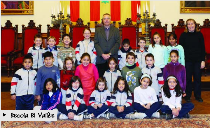
► Escola El Vallès