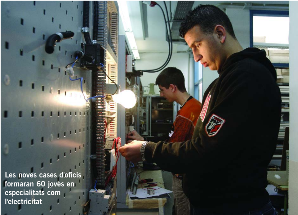
Les noves cases d'oficis formaran 60 joves en especialitats com l'electricitat

S'invertiran més de 5,3 milions d'euros per formar i facilitar la inserció laboral de les persones que es troben en situació d'atur a la ciutat