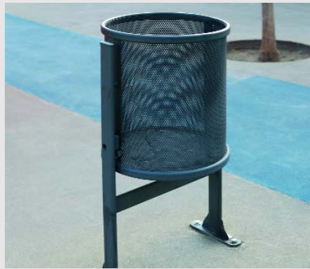
S'han col·locat un total de 72 papereres Contenur amb una capacitat de 70 litres