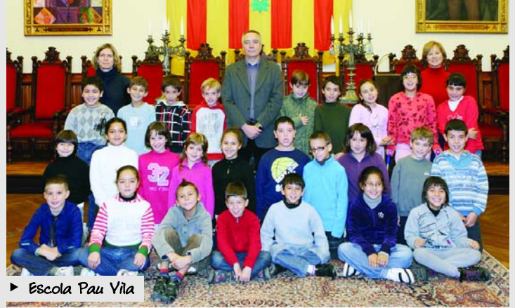
► Escola Pau Vila