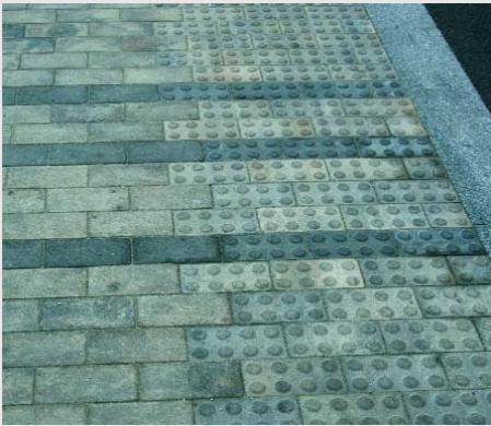
Els extrems del passeig central compten amb un relleu adaptat a persones invidents