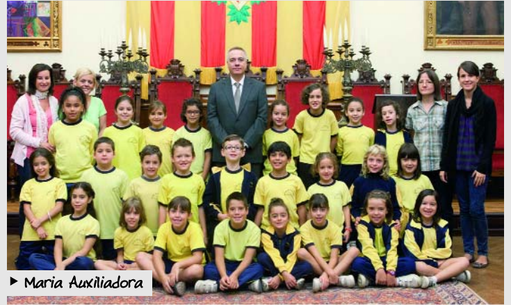
► Maria Auxiliadora