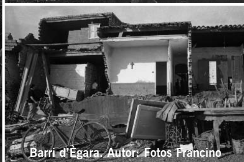
Barri d'Ègara.