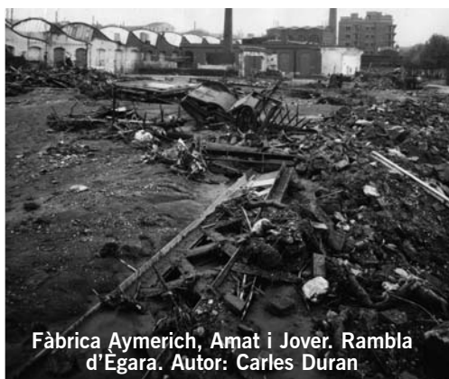
Fàbrica Aymerich, Amat i Jover. Rambla d'Ègara. Autor: Carles Duran