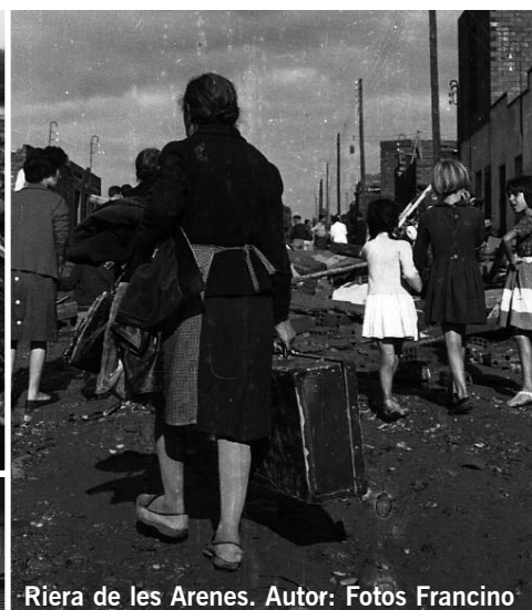
Riera de les Arenes.