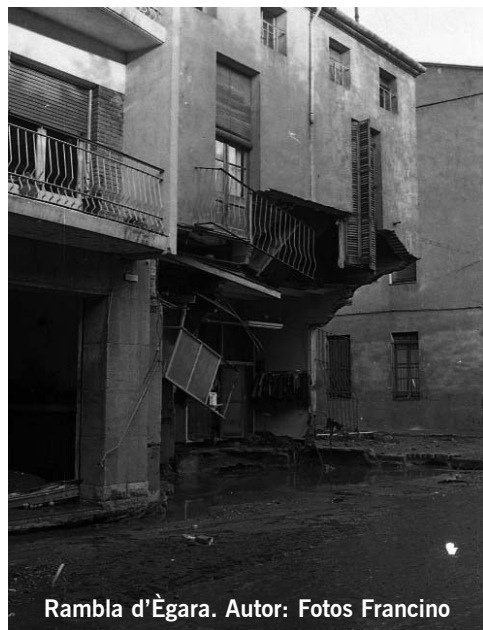
Rambla d'Ègara.

El Ple de l'Ajuntament ha acordat començar a treballar en un programa d'actes que recordi aquest tràgic esdeveniment