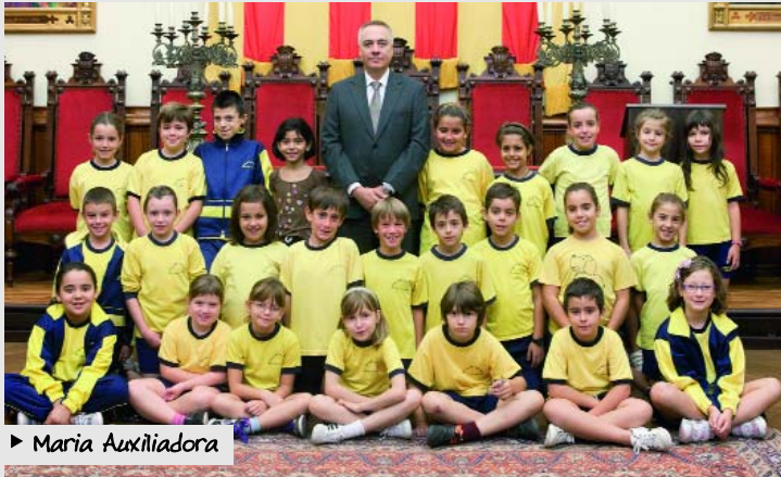
► Maria Auxiliadora