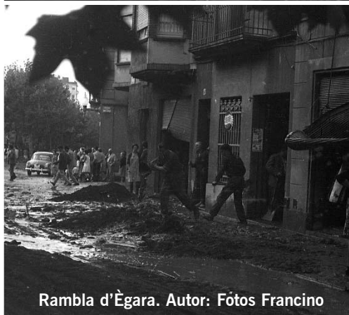
Rambla d'Ègara.