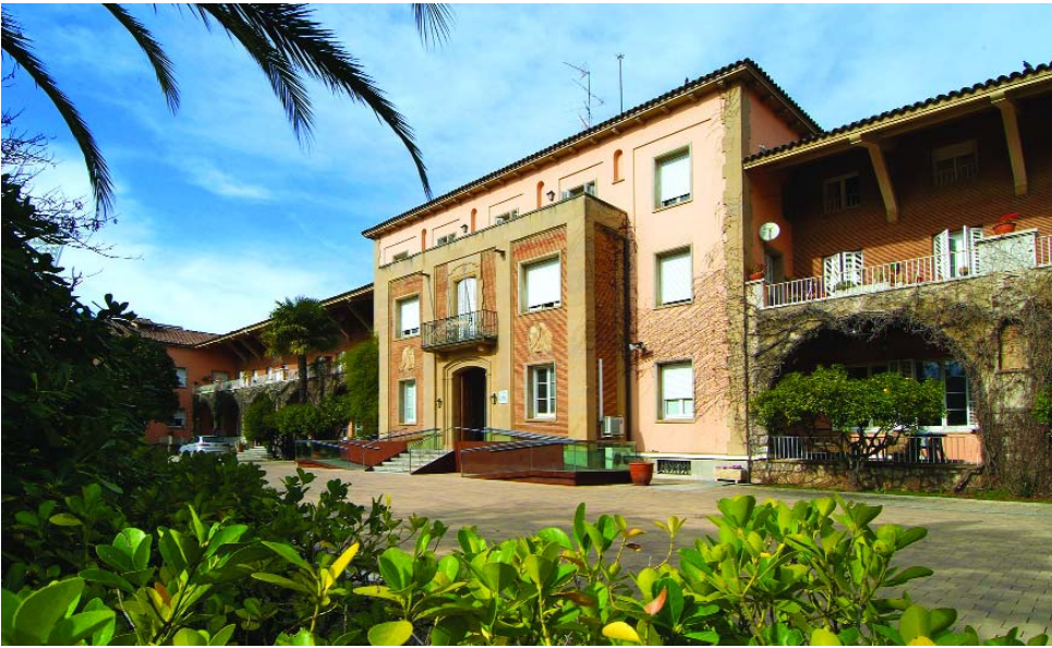
La residència per a persones grans La Llar Unnim és un dels quatre grans equipaments de l'Obra Social d'Unnim Caixa a Terrassa