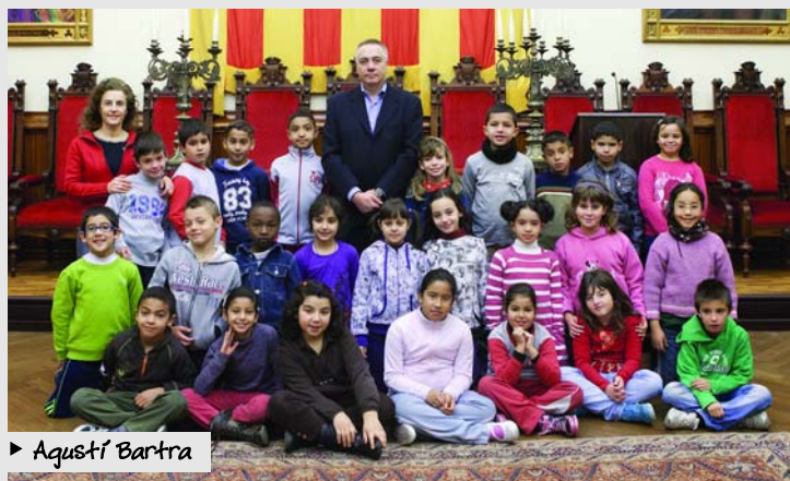
► Agustí Bartra