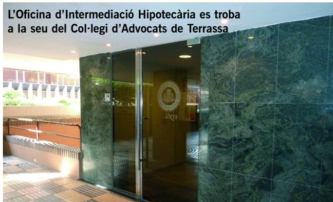
L'Oficina d'Intermediació Hipotecària es troba a la seu del Col·legi d'Advocats de Terrassa

Donarà servei a persones i famílies que tenen dificultats per fer front al pagament dels préstecs hipotecaris o amb risc de perdre el seu domicili habitual per impagament