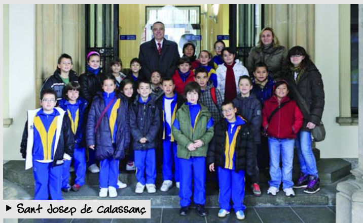
► Sant Josep de Calassanç