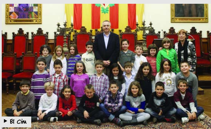
► El Cim