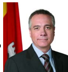
Pere Navarro i Morera Alcalde de Terrassa

parts interessades. Paral·lelament a la creació de l'Oficina d'Intermediació Hipotecària, s'activarà una comissió de seguiment on participaran les entitats financeres, les plataformes d'afectats, entitats del tercer sector, el Col·legi d'Advocats de Terrassa i altres col·legis professionals vinculats.