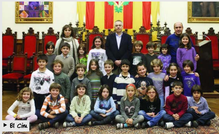
► El Cim