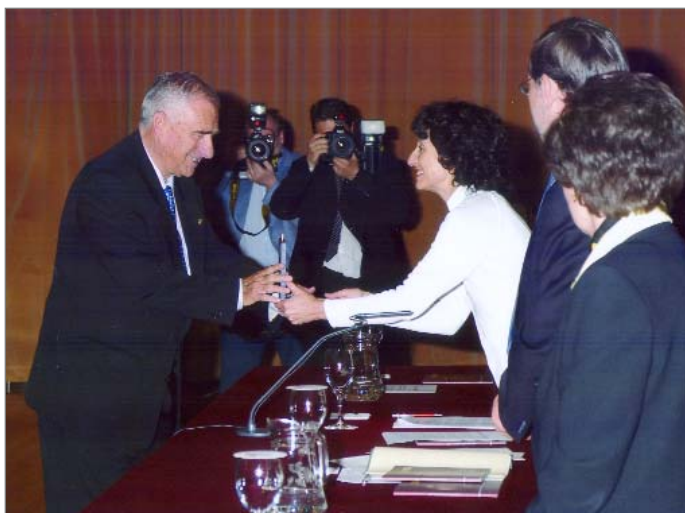
Entrega per part de la Ministra de Cultura Mercedes Cabrera de la Medalla de Oro de la Real Orden del Mérito Deportivo (2008)