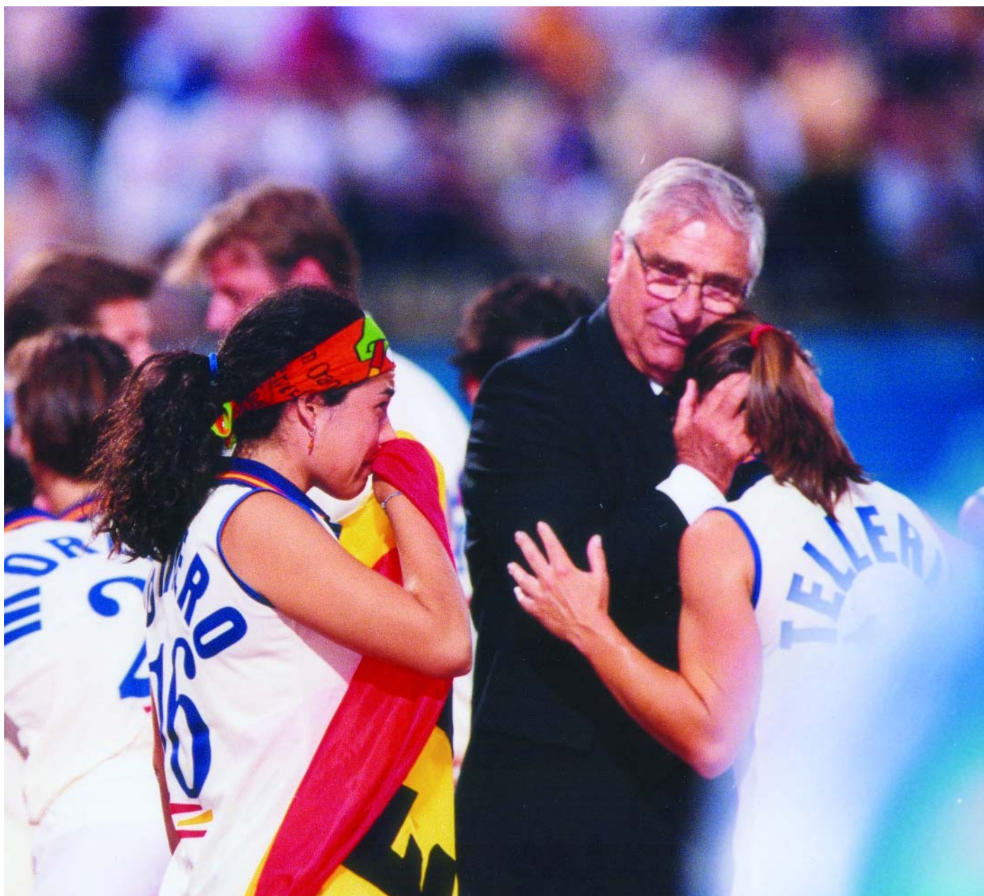
Amb les jugadores de la Selecció Espanyola als Jocs Olímpics de Sidney després de quedar quarts