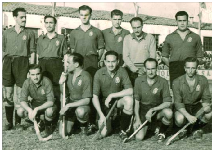
Amb la selecció espanyola un partit contra Pakistan l'any 1951