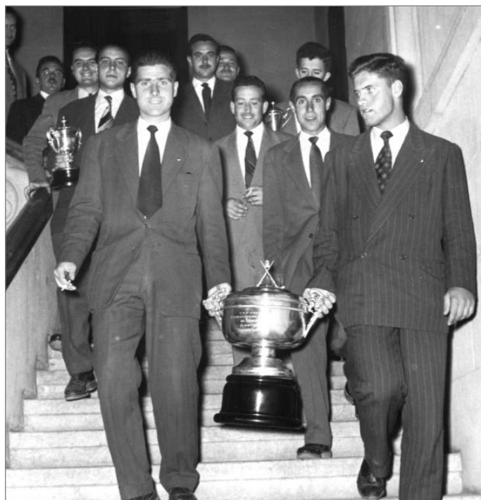
A l'Ajuntament de Terrassa amb una de les Copes de Campions d'Espanya

L'any 1982 va a la Copa del Món de Bombay com a cap de l'equip amb la selecció espanyola.