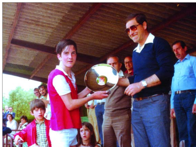
Entrega de premis dels Campionats de Catalunya com a President de la Federació Catalana.