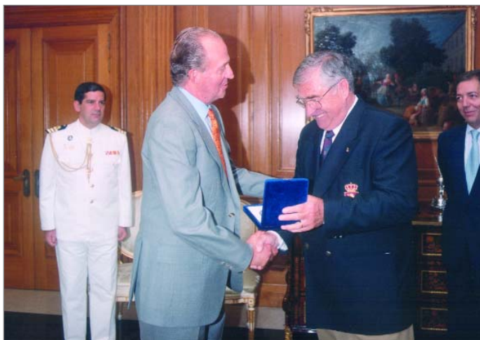
Entrega al Rei de la Medalla del 75è aniversari de la Real Federación Española de Hockey