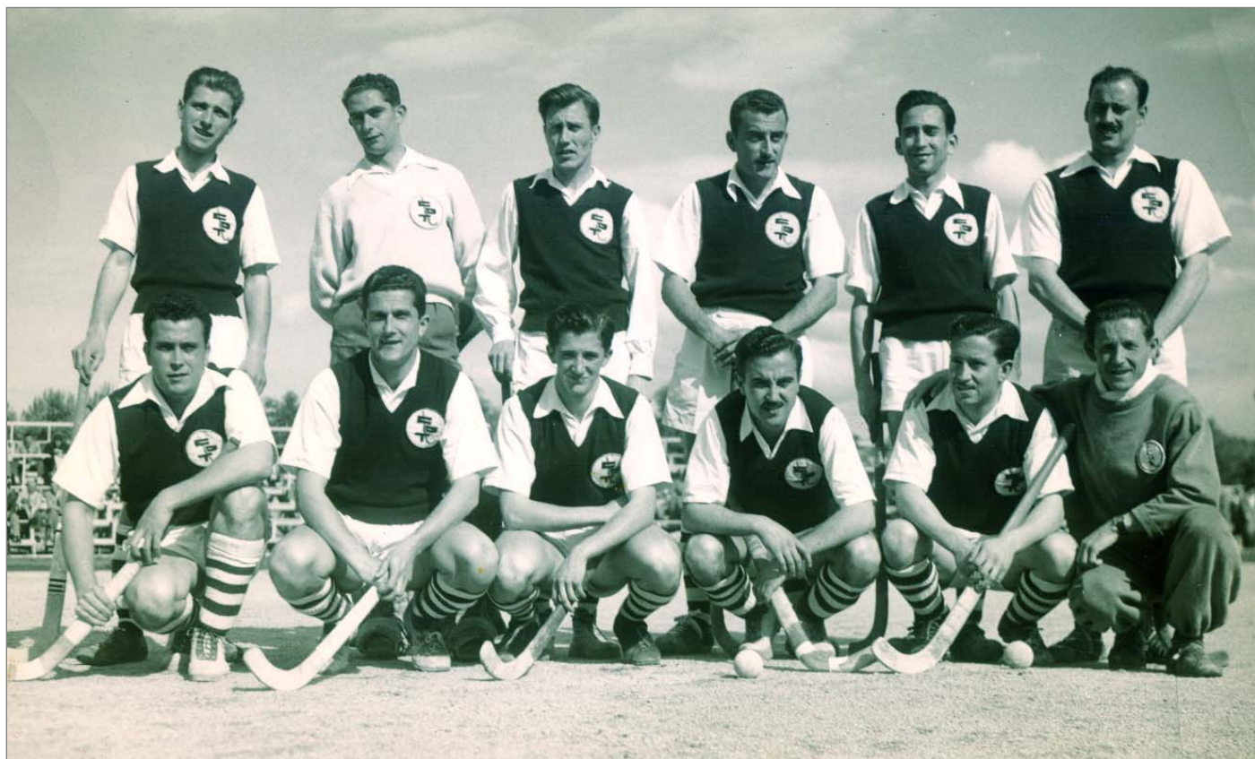
Equip del CD Terrassa Hockey l'any 1949