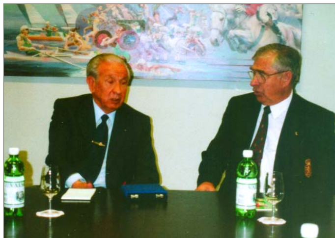
Entrega a Joan Antoni Samaranch, president del CIO a Lausana de la Medalla del 75è aniversari de la Real Federación Española de Hockey