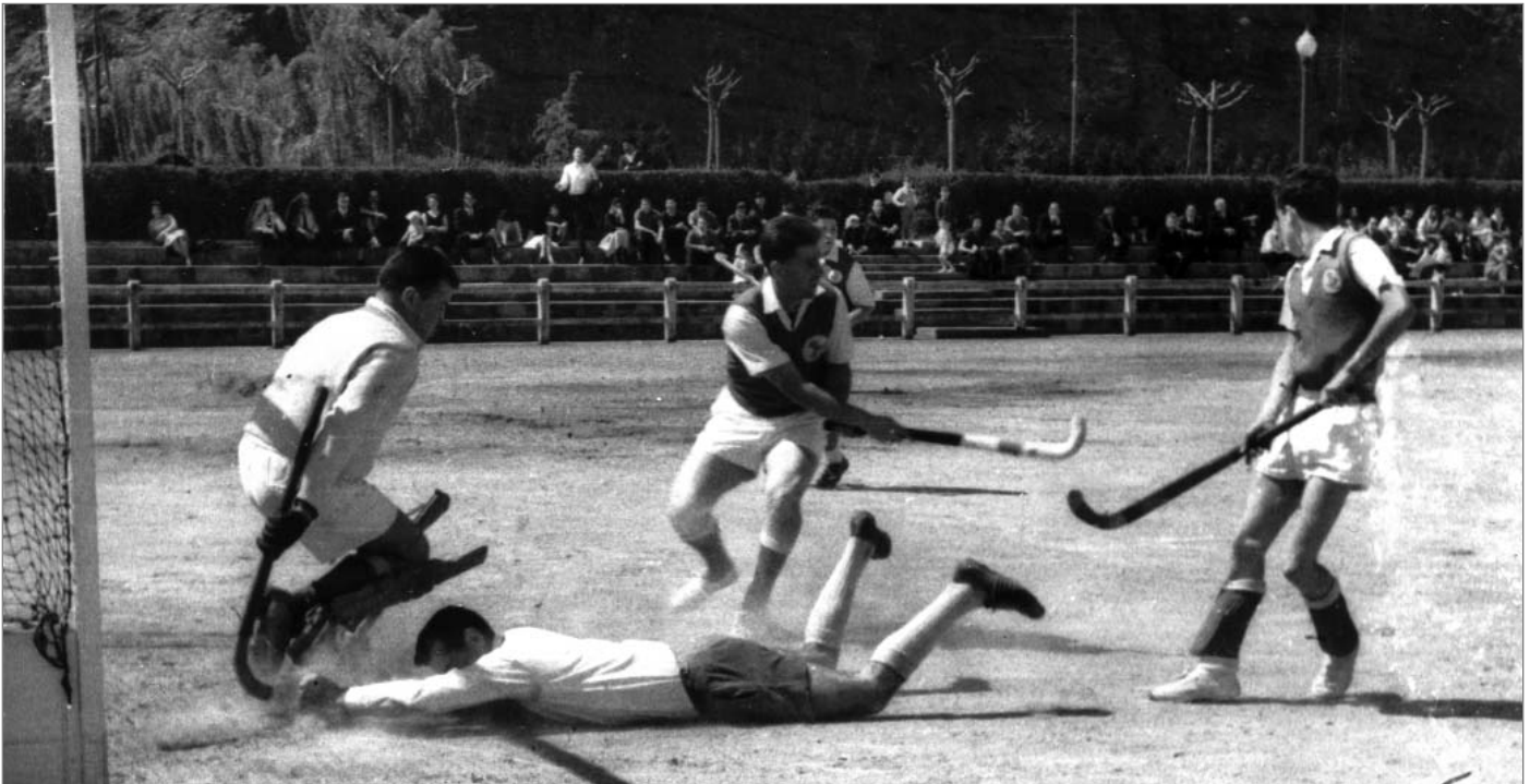
Partit CD Terrassa - RC Polo al Polo