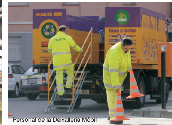
Personal de la Deixalleria Mòbil