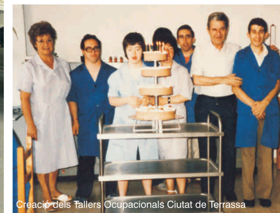
Creació dels Tallers Ocupacionals Ciutat de Terrassa