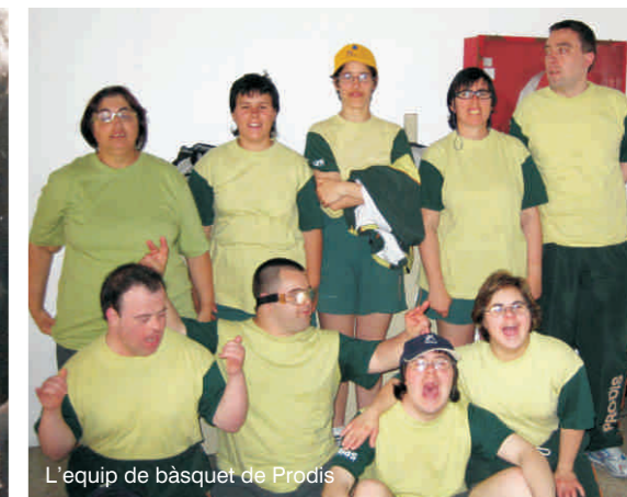
L'equip de bàsquet de Prodis