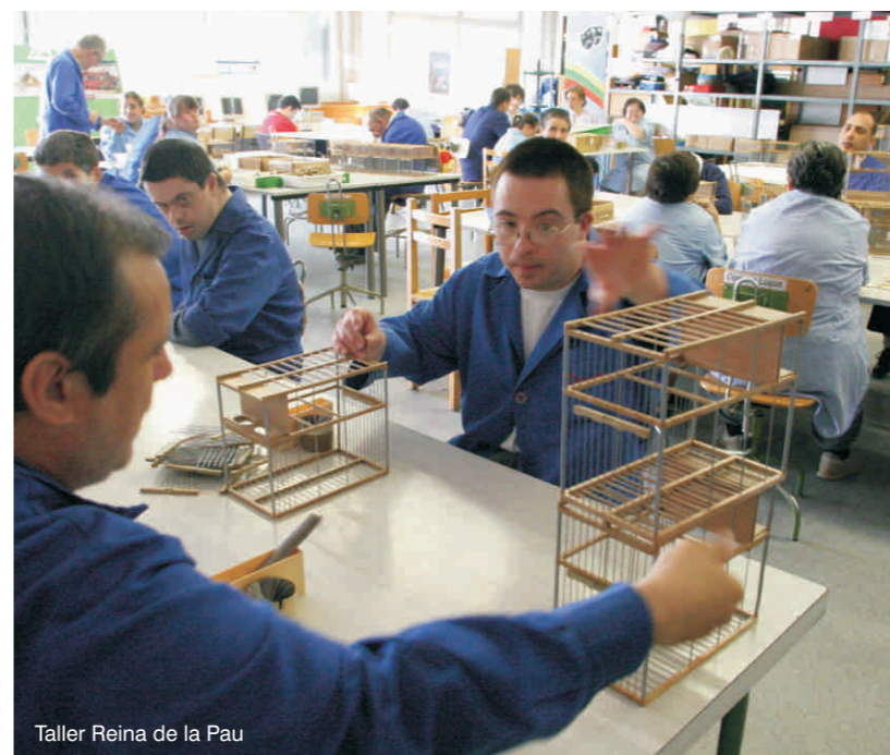
Taller Reina de la Pau