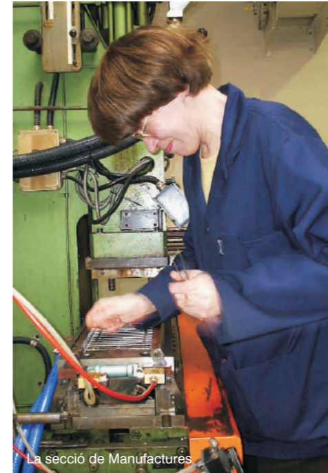
La secció de Manufactures

Com a entitat d'iniciativa social, sense ànim de lucre, destinada a l'assistència i la promoció integral de les persones adultes amb discapacitat psíquica, malaltia mental o paràlisi cerebral, legalment reconegudes i centrada prioritàriament a Terrassa i la seva comarca natural, PRODIS engegava una nova etapa fins el que és avui: una entitat terrassenca al servei dels terrassencs.