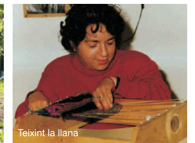
Teixint la llana