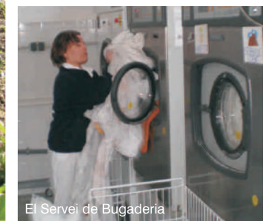
El Servei de Bugaderia