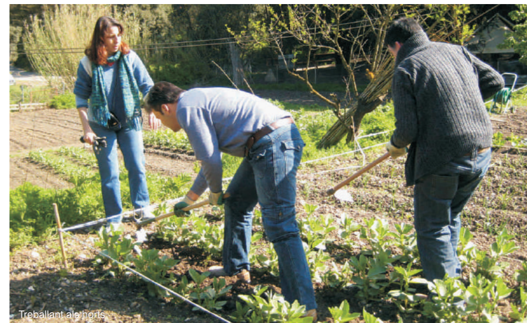
Treballant als horts