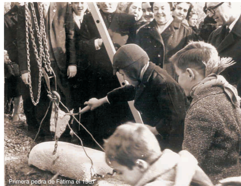
Primera pedra de Fàtima el 1961

La primera empenta havia estat positiva, aquest reconeixement era la millor energia per a una sèrie d'accions en anys provinents. Es començava a configurar un sistema d'ajuda, suport, reconeixement, integració, formació de les persones amb discapacitat. Així, el 1971, es creaven els tallers protegits Amat