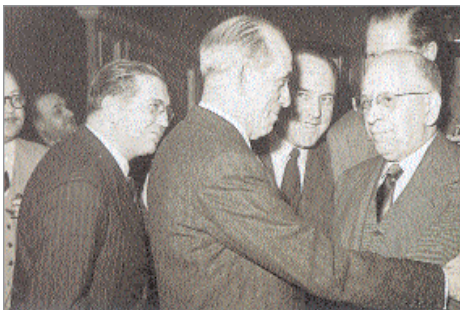
Homenatge a Asterio Gutiérrez. Autor: Jaume Altimira. Procedència: Joan Estrenjer