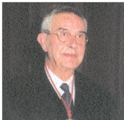
Joan Sales i Homs