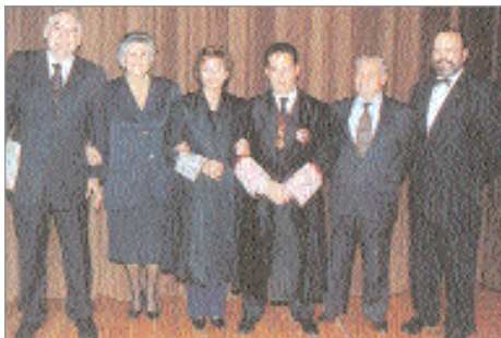
Els lletrats homenatjats en motiu del seu 25è aniversari com a col·legiats.