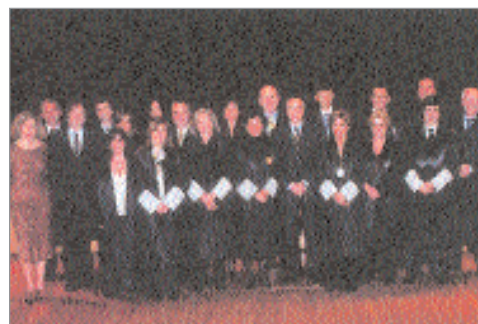
La Junta de Govern i Degans catalans. Any 2006. Col·legi d'Advocats de Terrassa