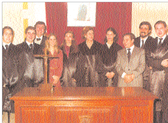
Nous togats. Festa Sant Raimon, gener de 1979.