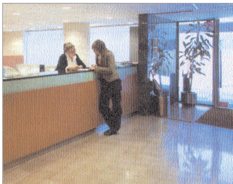
Instal·lacions del Col·legi d'Advocats de Terrassa