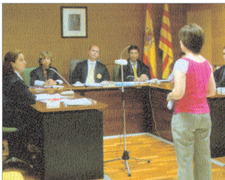
Prova final EPJ, 29 de juny de 2004