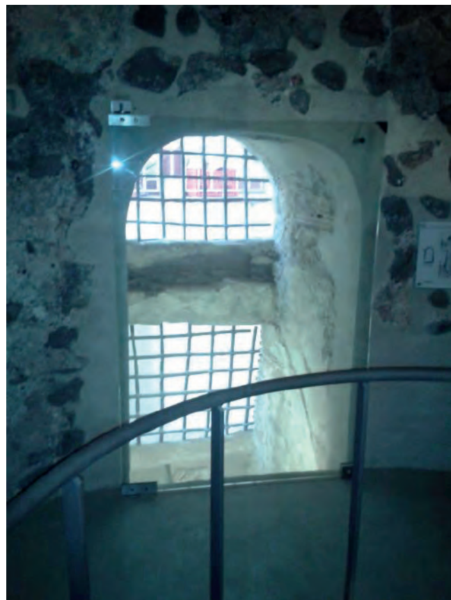
Interior de la Torre del Palau. L'edifici va ser la presó i l'espai de tortura de les dones acusades de bruixeria