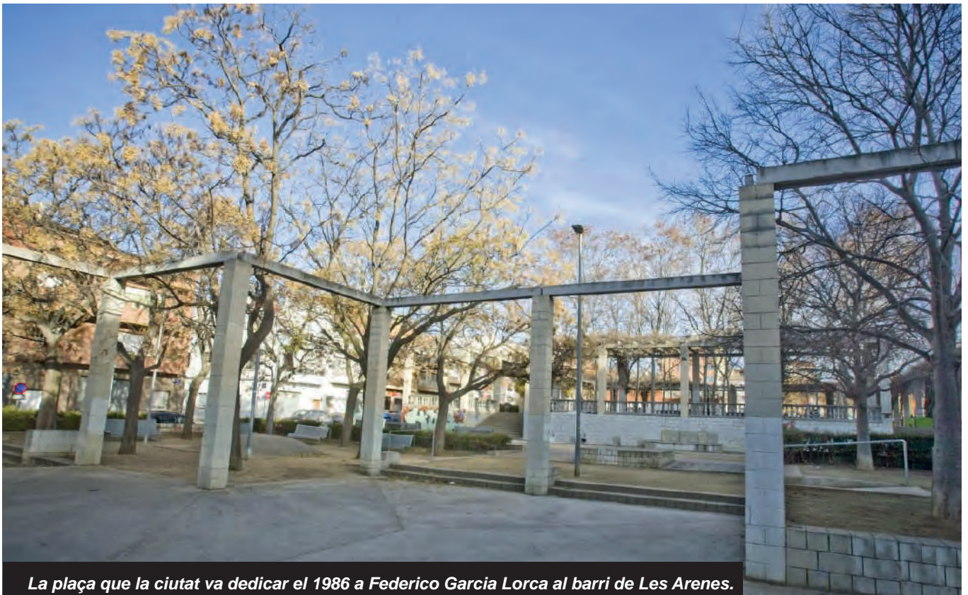
La plaça que la ciutat va dedicar el 1986 a Federico Garcia Lorca al barri de Les Arenes.

Fragment de l'article publicat per Mercè Boladeras el 9 de juny de 2021 al Diari de Terrassa