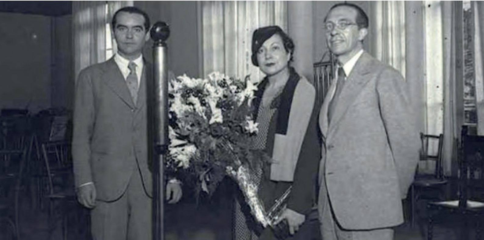
Fotografia de Federico García Lorca amb l'actriu Margarida Xirgu i el dramaturg Cipriano Rivas Cherif, realitzada por Josep Brangulí en 1935, probablement durant la seva visita als Amics de les Arts i JJ.MM. de Terrassa.