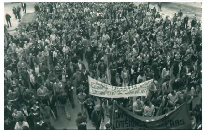
Les fotografies corresponen a diferents manifestacions obreres a Terrassa, i han estat cedides per l'arxiu històric de Comissions Obreres de Catalunya.