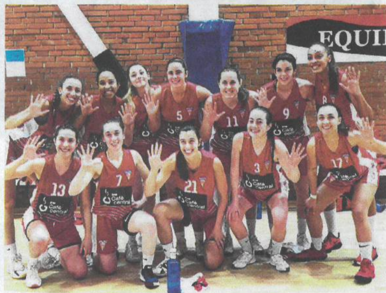
Les components de l'equip femení del CN Terrassa

L'equip femení del CN Terrassa, que milita al grup 2B del Campionat d'Espanya de Primera Divisió, va vencer el Grup Barna a domicili (48-58) en partit corresponent a la novena jornada de la competició. Amb aquesta victòria, el conjunt dirigit pel tècnic Jordi Sociats se situa líder de grup amb 12 punts i fa un pas de gegant per classificar-se per a la final a vuit de la competició, que tindrà lloc a Vic del 28 al 30 de maig. La fase final aplegarà els dos primers de cadascun dels quatre grups que integren el campionat.