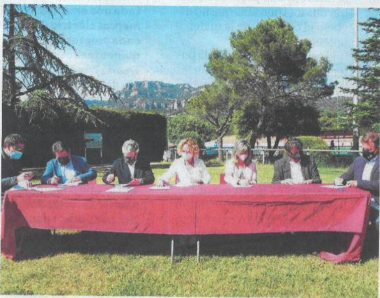
La signatura del conveni es va celebrar a Les Pedritxes.

Eina Cooperativa, entitat d'iniciativa social amb seu a Terrassa que ofereix serveis socioeducatius al Vallès, i els clubs de hockey de Terrassa i Matadepera, juntament amb Hockey per Terrassa, han signat un acord per desenvolupar un projecte de promoció i foment del hockey a les escoles.