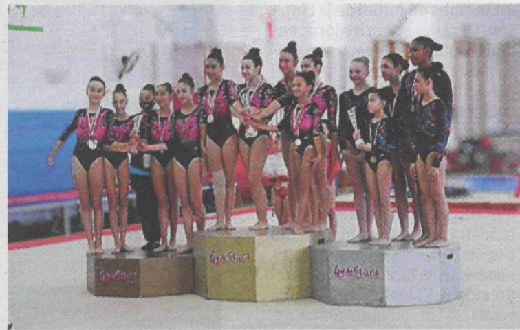
Un primer i un tercer lloc per equips pel conjunt egarenc