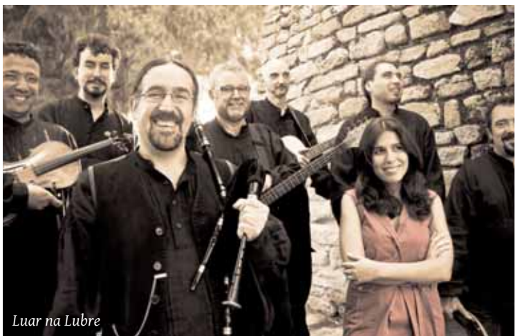
Luar na Lubre