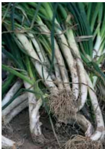
El calçot és un brot de ceba tendra arrencat i tornat a plantar.

E ls calçots s'han de fer a la graella, i si pot ser amb la fusta vella dels ceps que sobra després de la verema, com mana la tradició, molt millor. S'acostumen a presentar embolicats sobre una teula, i la manera de menjar-los desperta gairebé tanta afició com el seu peculiar sabor. És impossible no ennegri-se les mans amb el procés d'agafar el calçot i treure la pell cremada que recobreix l'apetitosa tija, però no patiu, a tots els restaurants us oferiran pitets i tovallonets per recuperar les formes després d'aquesta modesta transgressió de la bona educació a taula. En una calçotada, tan important és la qualitat dels ingredients que ens presenten, com la petita festa que suposa menjar i beure fent, per un dia, un petit excés. Ja sigui fent-la en parella, amb la família, o amb un grup d'amics, la calçotada acaba convertint-se en un autèntic ritual gastronòmic que cal gaudir amb la millor companyia. A la nostra ciutat hi ha diversos restaurants on es pot viure aquesta festa gastronòmica, aquí teniu tres propostes.