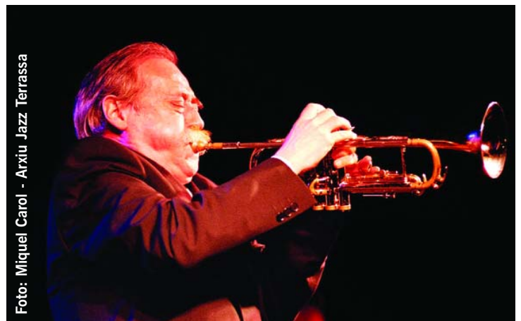
► Divendres 28, 22 h / Nova Jazz Cava / 10 euros FARRÀS-ROMANÍ HOT JAZZ CATS

Magnarelli. Baevsky ha recorregut amb èxit els millors locals de Nova York i París.