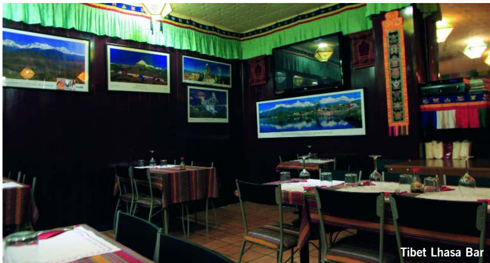
Tibet Lhasa Bar

Una cultura que viu entre dues grans potències té tendència a veure's empètitida. Si, a més, hi sumem que es troba a la zona més alta de la Terra, i una de les més inhòspites, és normal que passi gairebé desapercebuda. El