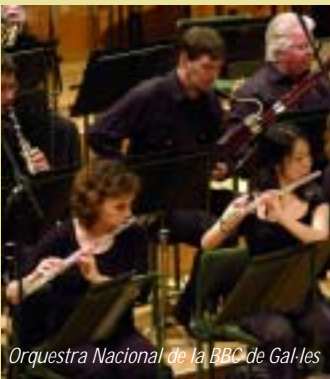
Orquestra Nacional de la BBC de Gal·les

■ L'Orquestra Nacional de la BBC de Gal·les oferirà un concert simfònic amb un programa integrat per obres de Ravel, Rakhmaninov i Beethoven. Centre Cultural Caixa Terrassa, 21 h.