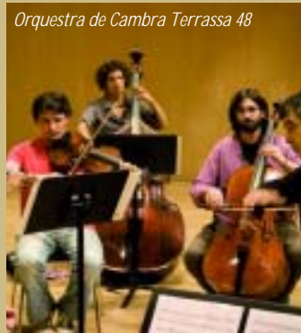
Orquestra de Cambra Terrassa 48

■ Orquestra de Cambra Terrassa 48: "Alemanya & Àustria, música centreeuropea", un concert amb interpretacions de peces de Mozart, Schreker, Hindemith i Schumann. Auditori Municipal, 19 h.