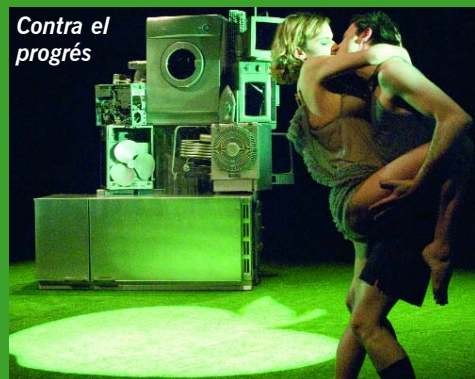
Contra el progrés

L'aclamadíssima trilogia d'Esteve Soler es pot veure per primera vegada com un conjunt. Des que el 2008 Contra el progrés fou descoberta a Berlín, els textos de l'autor manresà han estat traduïts a diverses llengües i representats arreu d'Europa amb gran èxit.