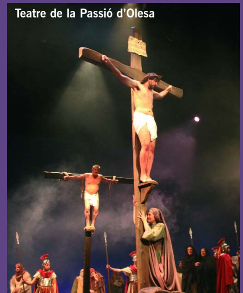
Teatre de la Passió d'Olesa

Dijous 21 de març - 21 h - 15 euros Considerat per la crítica i el públic com un dels joves pianistes de més projecció