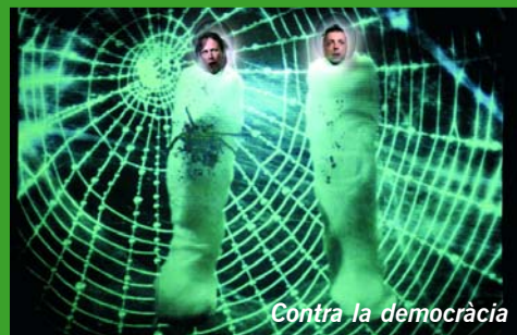
Contra la democràcia