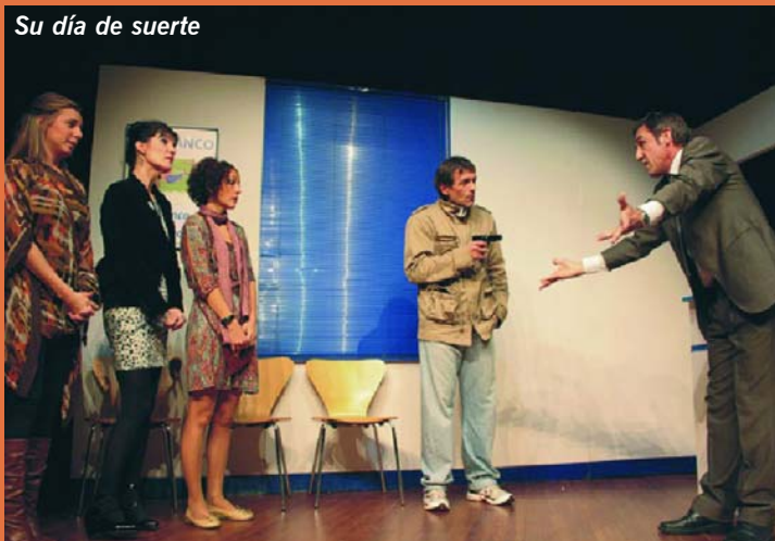
Su día de suerte

reu de Catalunya. Totes les obres es representaran a la Sala Crespi del Casal de Sant Pere (carrer Major de Sant Pere, 63) els diumenges a les 6 de la tarda. El preu de l'entrada és de 8 euros per a socis, estudiants, jubilats i subscriptors del Diari de Terrassa o de La Torre , i de 10 euros per al públic en general. Si us agrada el teatre, no us les podeu perdre!