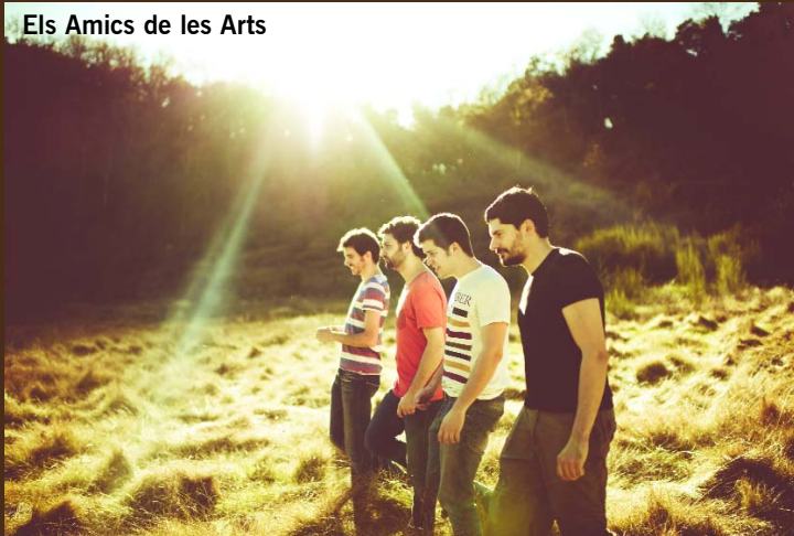
Els Amics de les Arts

Divendres 8 de febrer - 23 h - 15 euros anticipada / 18 taquilla Els Amics de les Arts