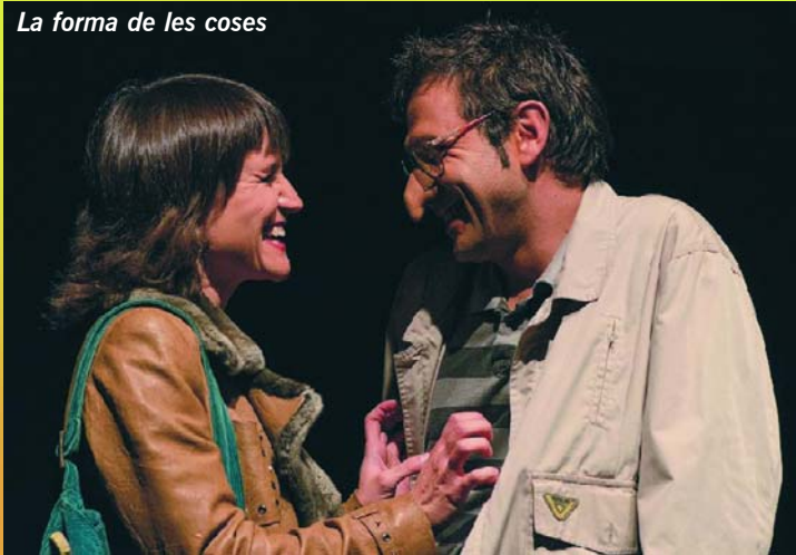
La forma de les coses