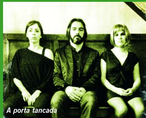
A porta tancada

natges principals és romandre tancats junts a la mateixa habitació per tota l'eternitat.