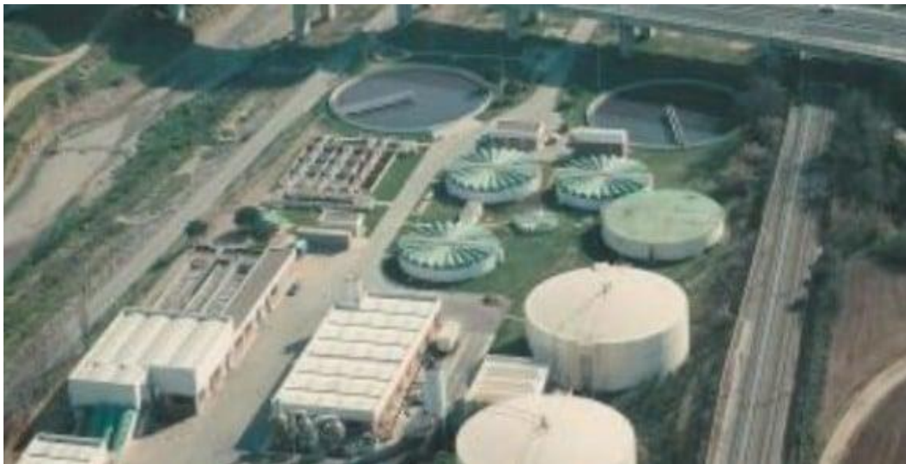
EDAR TERRASSA – Instalaciones actuales

Capacidad de tratamiento: 90.000 m 3 /día Sistema MBR (parado): 15.000 m 3 /día