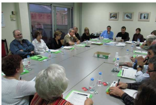
TAULA DE CIUTAT

S'han creat set taules participatives : una per cada districte i una de ciutat.