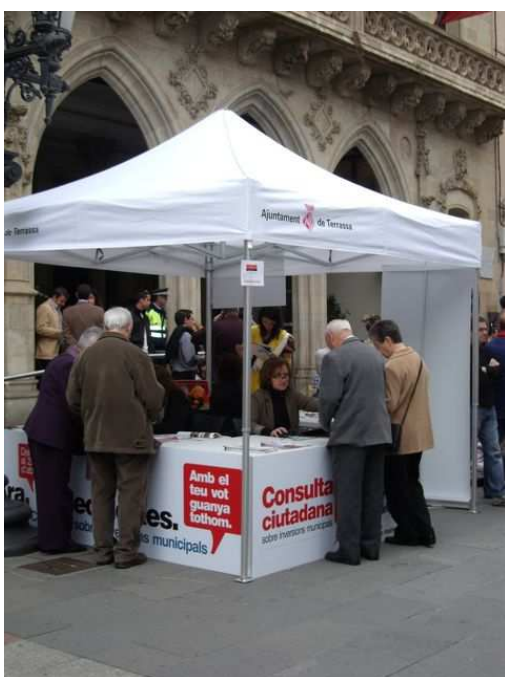
Punt de votació ubicat durant la Diada de St. Jordi al Raval de Montserrat