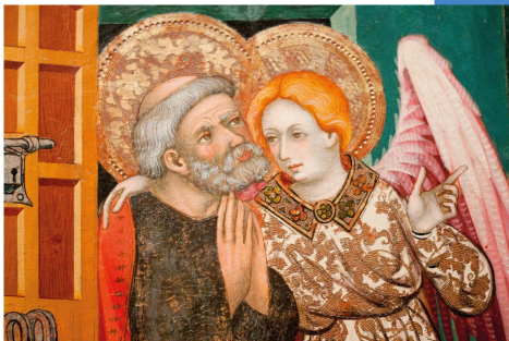
Retaule de Lluís Borrassa